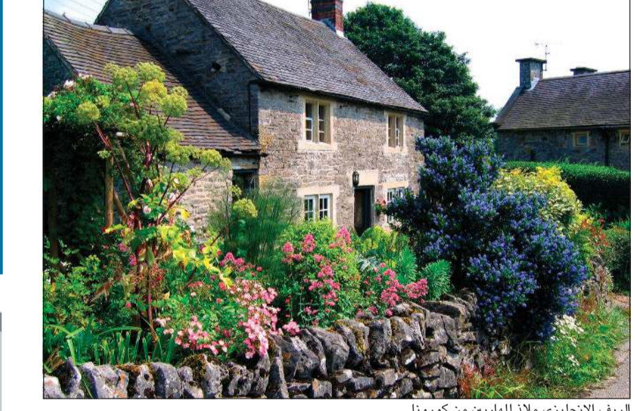
الريف الإنجليزي ملاذ للهاربين من كورونا

ذكر موقع «ديلي أونلاين» أن بريطانيا تشهد اتجاهها متزايداً للهجرة من المدن الكبرى إلى البلدات الصغيرة والقرى نتيجة وباء كورونا. وأوردت الصحيفة نقلاً عن مكاتب عقارية ومواقع إنترنت أن هذا الاتجاه ليس محكوماً باعتبارات مالية لأن أسعار العقارات في الأرياف القريبة من المدن تفوق أسعارها في المدن نفسها. ويضيف الموقع أن الاستفسارات غالباً ما تكون حول بلدات وقرى تابعة للمدينة، مما يرجح أن يكون الراغبون في الانتقال حريصين على الاحتفاظ بوظائفهم الحالية مع عدم الخشية من الاضطرار لقطع مسافات طويلة إلى أعمالهم بعد انتشار فرصة العمل من المنزل. ويرى الخبراء العقاريون أن الأرياف تمثل جانباً قوياً للسكن بما توفره من مساحات طبيعية أرحب وهدوء وقلّة تلوث وحياء اجتماعية أكثر حميمية. ويحتل وجود حديقة للمنزل أفضلية واضحة لدى الهاربين من السكن في بيوت ذات حدائق