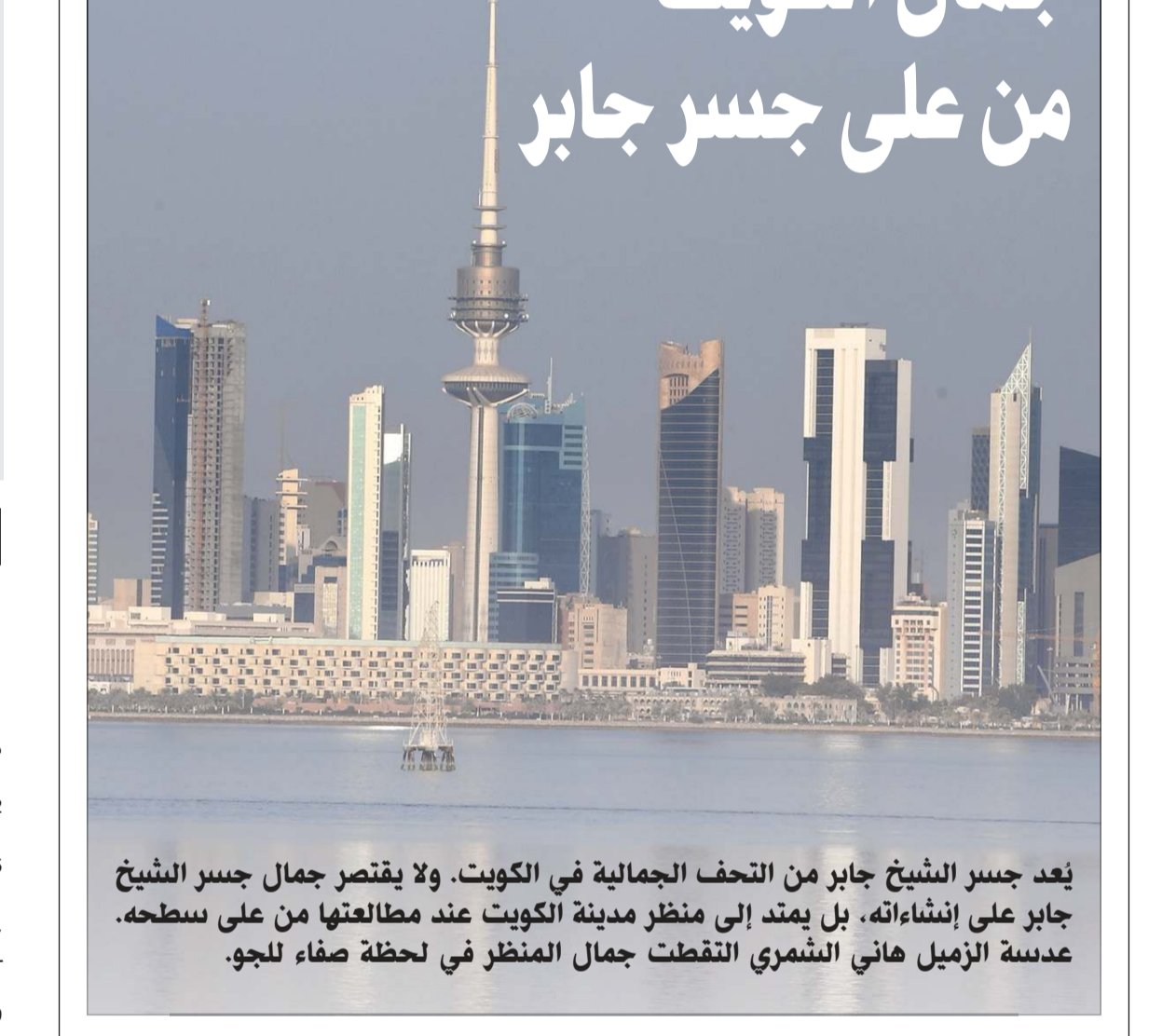
يُعد جسر الشيخ جابر من التحف الجمالية في الكويت. ولا يقتصر جمال جسر الشيخ جابر على إنشاءاته، بل يمتد إلى منظر مدينة الكويت عند مطالعتها من على سطحه. عدسة الزميل هاني الشمري التقطت جمال المنظر في لحظة صفاء للجو.