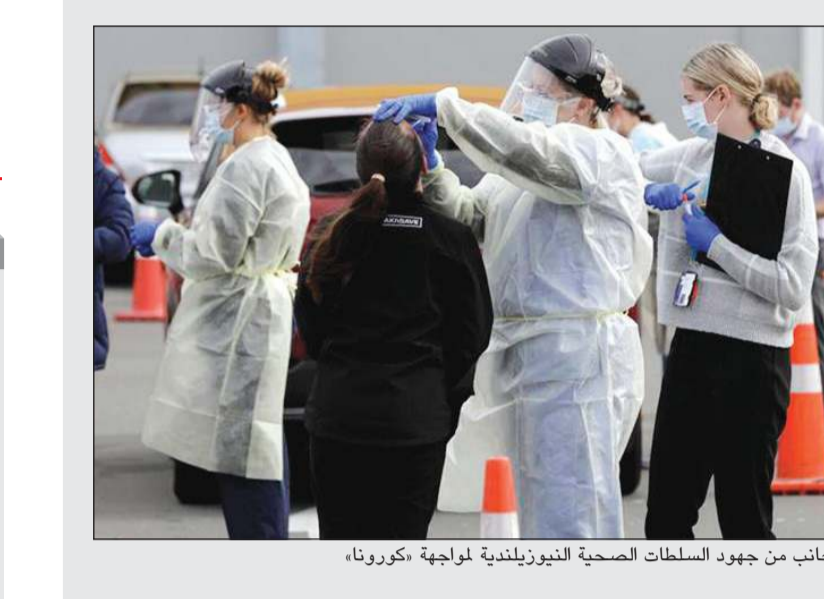
جانب من جهود السلطات الصحية النيوزيلندية لمواجهة «كورونا».

يقول للنيوزيلنديين أن يفخروا بأن بلادهم تعتبر واحدة من أكثر بلدان العالم أماناً إزاء فيروس كورونا. لهم بالطبع أن يناموا قريبي العين، ولكن وكما تقول صحيفة «انديبننت»، بين واحدة مفتوحة على الدول التي تغلبت لوهلة من الزمن على الفيروس القاتل قبل أن يفلت من عقاله مرة أخرى. البلاد حسب الصحيفة تتحسب لمعركة جديدة ليس ضد الفيروس فقط بل أيضاً ضد الاستهانة به. وتضيف الصحيفة أن آخر انتقال من داخل البلاد للعدوى كانت قبل 97 يوماً وكانت كل حالات العدوى الأخرى الـ 24 بين مسافرين عائدين إلى البلاد. هؤلاء تم وضعهم قيد الحجر الصحي، ولكن المسؤولين قالوا أن المسألة ليست فيما إذا كانت ستحدث الإصابات خارج المحاجر بل متى سيحدث ذلك. قبل أشهر قليلة فقط كان تسجيل 1500 إصابة و22 حالة وفاة بالفيروس كافياً لفرض إغلاق صارم في البلاد خلال شهري مارس وأبريل، ولكن كل