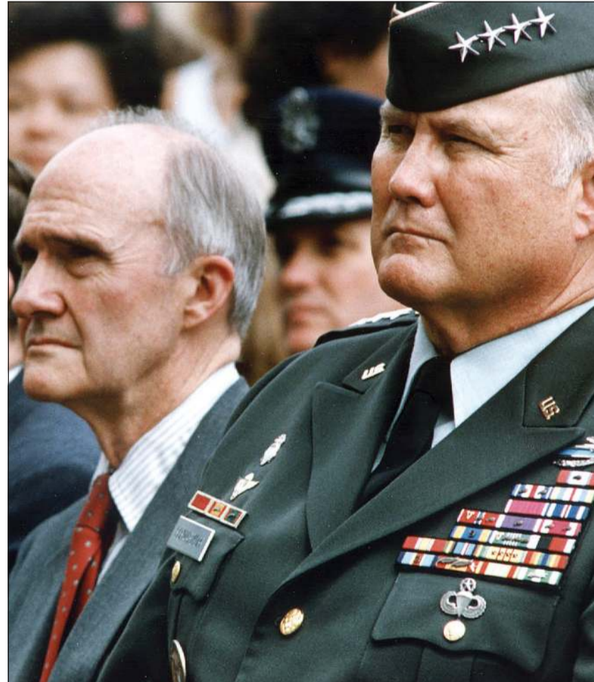
سكوكروفت مع نورمان شوارزكوف خلال فترة الغزو العراقي الآثم

ويقول سكوكروفت عن لحظات الغزو الأولي: مع اننا سعينا للحصول على دعم الامم المتحدة منذ بداية الأزمة، فقد كان هذا جزءا من جهودنا لاقامة اجماع دولي وليس لاننا اعتقدنا اننا نحتاج الى تفويض