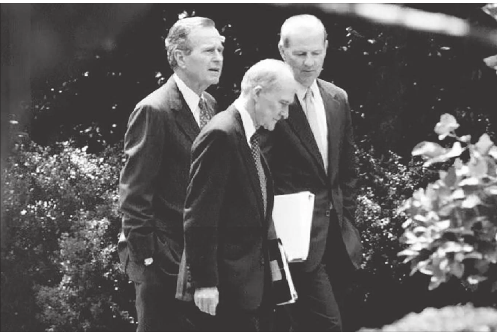
برنت سكوكروفت مع جورج بوش وجيمس بيكر عام 1991

وقالت المؤسسة أنه «اعتمد في فكره الذي منح الأولوية للاستراتيجية، على مبادئ أساسية بما فيها أهمية التاريخ في رسم السياسة الخارجية وضرورة تأييد محلي ودولي للقيادة الأميركية وكذلك العمل عبر الحلفاء والتحالفات والمؤسسات الدولية»، وقالت المؤسسة إن مراسم تشييعه ستقتصر على العائلة والمقربين.