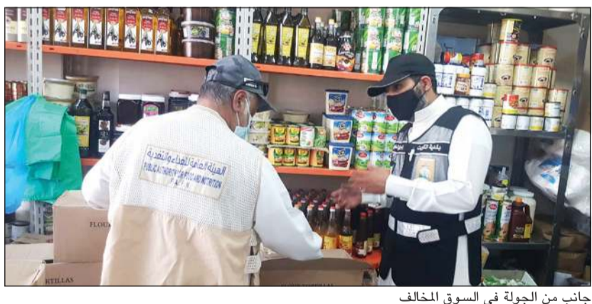
جانبا من الجولة في السوق المخالف

ضبط كميات كبيرة من المواد الغذائية منتهية الصلاحية إضافة إلى مصادرة أختام كانت تستخدم للغش التجاري من خلال التلاعب في تغيير تواريخ صلاحية المنتجات الغذائية. وأشار العنزي إلى تحرير 4 محاضر مخالفة من الجهات المشاركة بالجولة، مشيراً إلى أنه جار حصر الكميات المضبوطة تمهيداً لإتلافها، كما تمت مصادرة الأختام المستخدمة في تغيير تواريخ الصلاحية، مؤكداً أنه سيتم غلق السوق إدارياً مع إحالة مخالفة الأختام إلى النيابة التجارية.