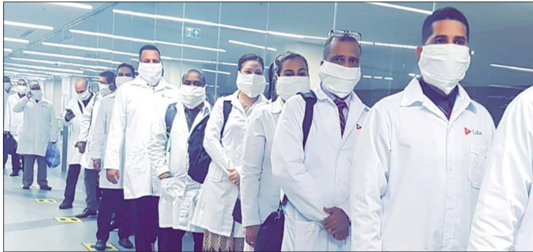
الدفعة الثانية من الوفد الطبي الكويتي لدى وصولها البلاد