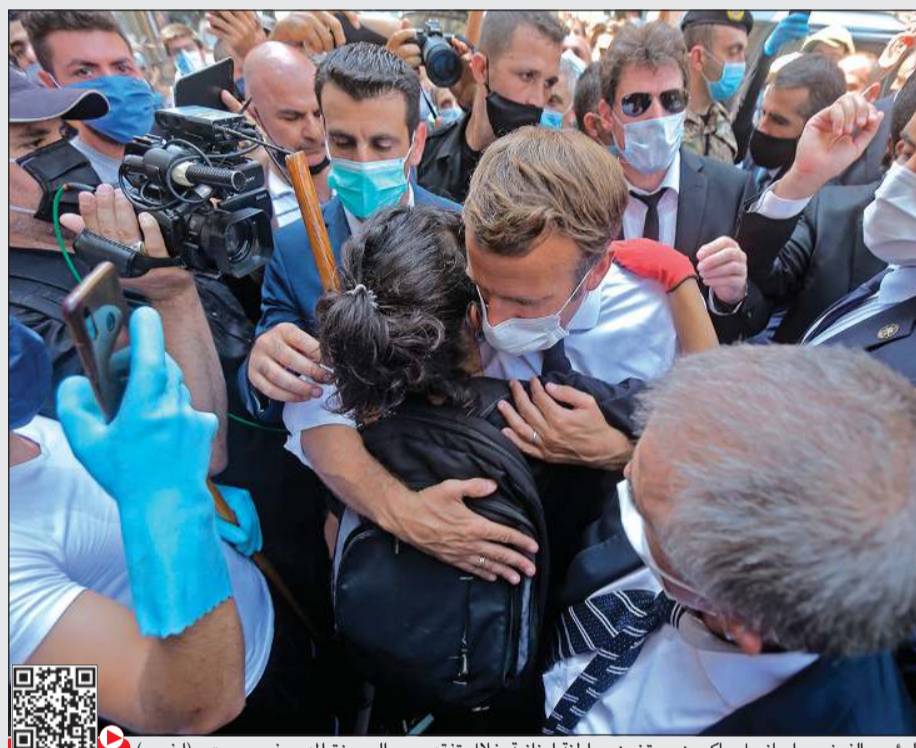
الرئيس الفرنسي إيمانويل ماكرون يحتضن مواطناً لبنانياً خلال تفقده حي الجبيرة المدمر في بيروت

وفي مؤتمر صحفي بنهاية الزيارة، قال ماكرون إن فرنسا ستدعو إلى مؤتمر دولي