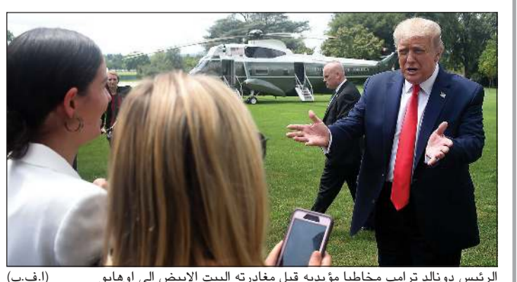
الرئيس دونالد ترامب مخاطباً مؤيديه قبل مغادرته البيت الأبيض إلى أوهايو

يراه خبراء الصحة في البيت الأبيض. يأتي ذلك، فيما يواصل الفيروس، حصد الأرواح وتسجيل أعداد قياسية من الإصابات، لا سيما في الدول الأكثر تضرراً وهي الولايات المتحدة والبرازيل والهند التي تسجل ثلاثتها أكثر من نصف الإصابات العالمية البالغة نحو 18 مليوناً و 847 ألف حالة.