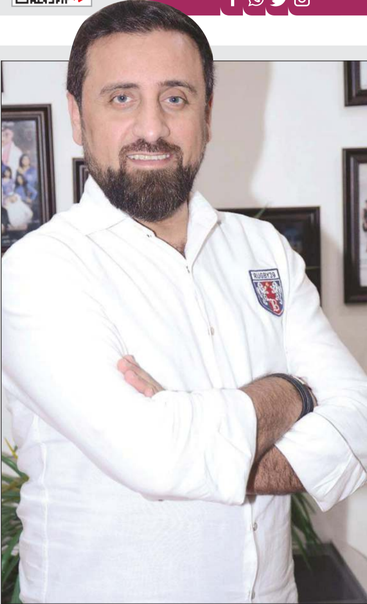
المخرج منير الزعبي