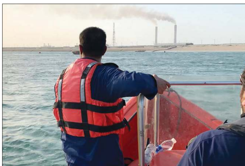
دوريات الإطفاء خلال البحث عن الفريق

أسعف وأفد مصري من مواليد 1993 إلى مستشفى الفروانية لإصابته بجرح في الرأس فيما أنقذت لوحة إعلان الوافد من الموت حيث سقط عليها، واستناداً إلى مصدر أمني فإن بلاغا ورد إلى عمليات الداخلية عن سقوط وافد من علو في منطقة خيطان، ولدى توجه رجال الأمن إلى موقع البلاغ شوهد وافد