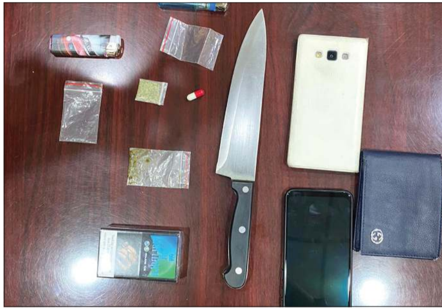
المضبوطات التي عثر عليها مع «البدون»

من جهة أخرى، أحال مدير عام مديرية أمن الفروانية العميد عبدالله سفاح إلى الإدارة العامة لمكافحة المخدرات وأفداً مصرياً من مواليد 1974 على خلفية حيازته مواد مخدرة على أن يحال إلى المحاكمة لمخالفة قرار حظر التجول وجار ضبط شخصين كانا برفقته وهربا على الإقدام. وكانت دورية تابعة لأمن الفروانية رصدت 3 أشخاص خلال فترة الحظر متوقفين مقابل إحدى البنايات ولدى اقتراب الدورية فر شخصين إلى جهة غير معلومة وتم ضبط قائد السيارة وتبين أنه مصري وبتفتيشه عثر بحوزته على كيس به مواد مخدرة.