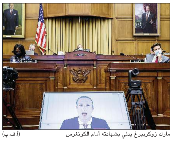
مارك زوكربيرغ يبدلي بشهادته أمام الكونغرس

واشنطن - أ.ف.ب: حاول النواب الأميركيون تلخيص أعوام من الإحباط تجاه الشركات المهيمنة على نشاط الإنترنت العالمي، إذ اتهم الديموقراطيون «غافا» (غوغل، آبل، فيسبوك، أمازون) بسحق منافسيها فيما اتهمها الجمهوريون بفرض رقابة عليهم. واستمعت اللجنة القضائية في مجلس النواب بواشنطن، والتي تحقق منذ عام حول احتمال استغلال هذه الشركات لموقعها المهيمن، إلى مسؤولي هذه الشركات وهم سوندار بيشاي (الفايت، الشركة الأم لـغوغل) وتيم كوك (آبل) ومارك زاكيريغ (فيسبوك) وجيف بيزوس (أمازون) عبر الفيديو. وقال ديفيد سيسيلين رئيس اللجنة الفرعية للقضاء