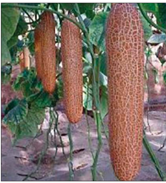
الخيار الصيني الأصفر

وللعلم فإن لون الخيار الأصفر يتحول إلى اللون البني مع مرور الوقت وتصبح القشرة الخارجية خشنة وصلبة كما هي موضحة في الصورة وتعرف بالخيار العجوز. كما تباع بذور هذه الشجرة في جميع المواقع التجارية الإلكترونية ولدينا البعض من المزارعين الهواة الذي يقومون بزراعة هذا النوع من الخيار في الكويت. وأضافت: ينبغي التأكيد على أن شجرة فاكهة الخيار الصيني لا تنتج حيوانات ولا تبيض أو تولد. ولكن يصدق هذه الأمر، فلماذا من أن يفحص قواه العقلية؛ الحيوان الذي ترونيه في الفيديو وخرج من الفاكهة هو الفأر المنزلي الحديث الولادة الذي يمتاز عادة باللون الوردي والذيل القصير. الفأر هو من الحيوانات الثديية ويحتاج إلى رحم مشيمة لكي ينمو ويتطور. المشيمة تكون البطانة