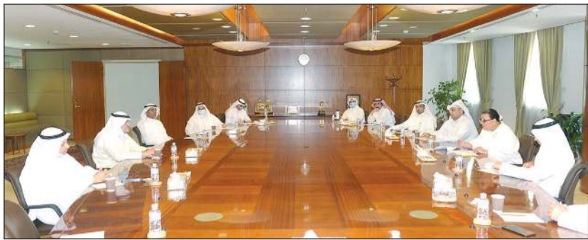
محمد الصقر مستقبلاً ممثلي أصحاب المدارس الخاصة

قال رئيس غرفة تجارة وصناعة الكويت محمد الصقر إن الغرفة تدرك تماما الآثار السلبية المترتبة على إيقاف النظام التعليمي والتأثير المباشر على الطلبة، وكذلك تدرك التحديات التي تواجهها الحكومة في اجتياز هذه المرحلة الصعبة، معرباً عن أمله في إيجاد حلول مناسبة لكل المعوقات، وذلك من خلال قيام الغرفة بالتنسيق مع الجهات المعنية للوصول إلى نتائج تتواءم والظروف الحالية. حديث الصقر جاء خلال استقباله أمس عدداً من ممثلي أصحاب المدارس الخاصة في الكويت، بحضور عدد من أعضاء مجلس إدارة الغرفة والإدارة التنفيذية، حيث ثمن دور المدارس الخاصة في تعزيز العملية التعليمية وتقديمها في الكويت، وخلال اللقاء، قام ممثلو أصحاب المدارس