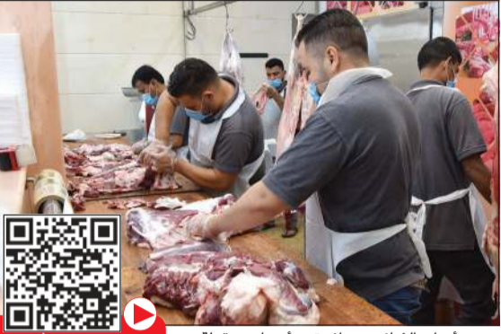
جميع أنواع الذبائح متوافرة وبأسعار معقولة