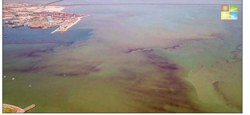
آثار رفع مستوى المغذيات في البيئة البحرية بشاطئ السلام وازدهار الطحالب في المنطقة

أكد مدير عام الهيئة العامة للمياه الشيخ عبدالله الأحمد ضرورة اتخاذ الإجراءات اللازمة لمراقبة ورصد ومتابعة مخارج الصرف الصحي على الشبكات مثل المناطق والمنشآت الخدمية والصناعية والعسكرية والصحية وغيرها التي تصرف على شبكات الأمطار.