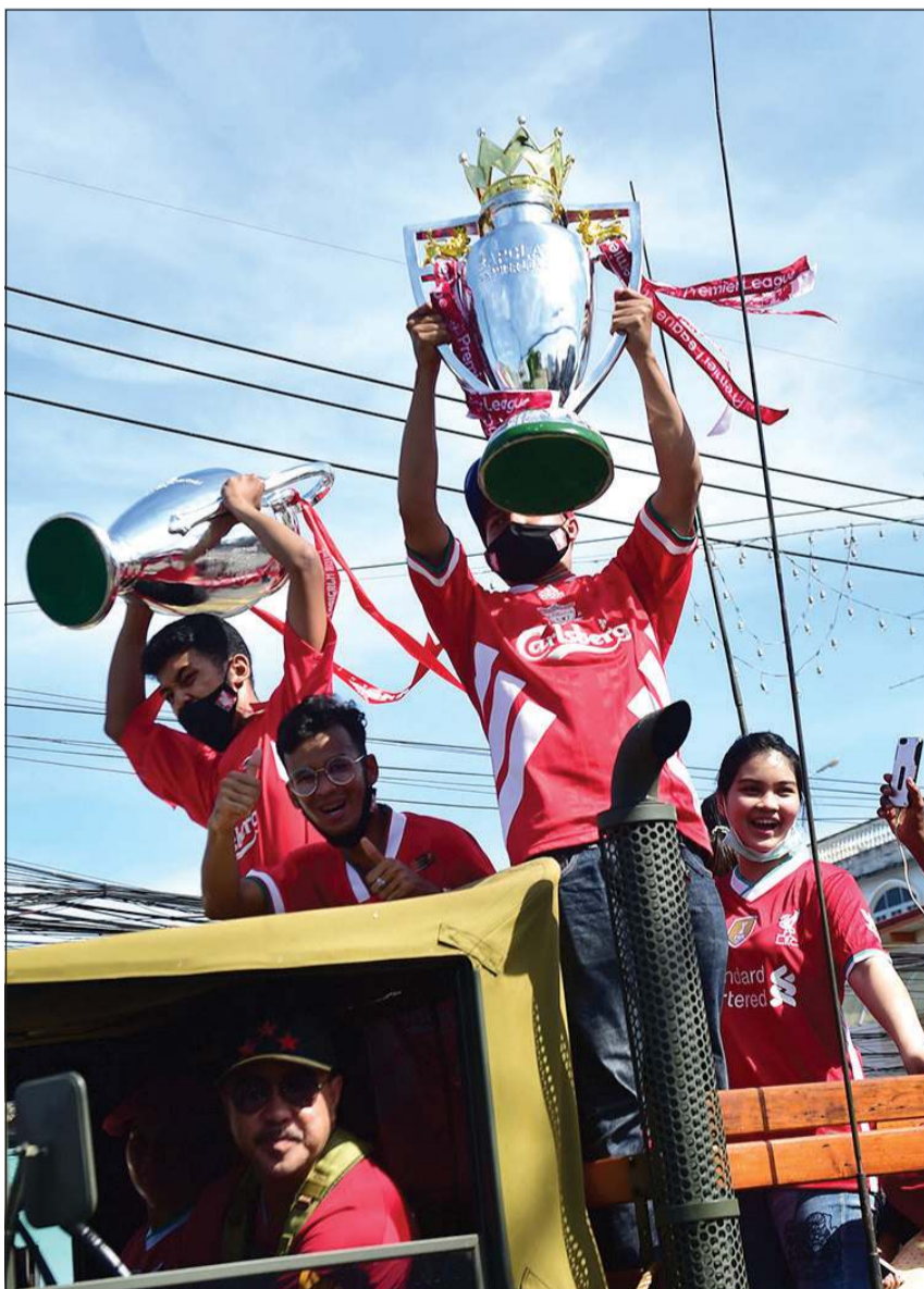
عشاق ليفربول يحتفلون في شوارع تايندا امس

بعد العديد من الأحداث المثيرة وحالات الجدل، اختتمت منافسات موسم 2020/2019 من الدوري الإنجليزي الممتاز لكرة القدم مساء أول من أمس بعد 11 شهراً من انطلاق منافساته. ورغم التوقف الاضطراري للمنافسات طوال 100 يوم بدأت في مارس الماضي بسبب جائحة فيروس كورونا المستجد، وأصل ليفربول تحطيم الأرقام القياسية في الموسم الذي شهد تتويجه بلقب الدوري للمرة الأولى خلال 30 عاماً، وقد حسم اللقب لصالحه في 25 يونيو الماضي إثر فوز تشلسي على البطل السابق مان سيتي 2-1.