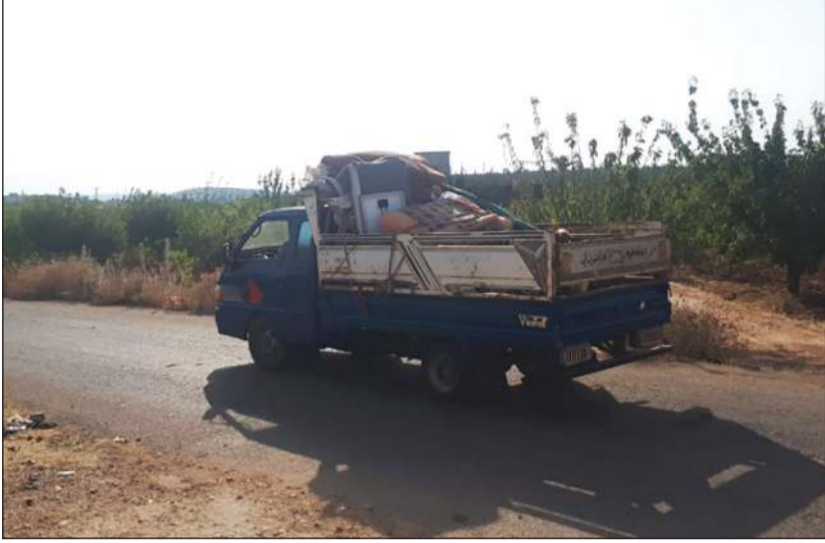
عائلة جمعت ما استطاعت ونزحت من منطقة التصعيد

وصاروخا، ومعظمها ينطلق من معسكري «جورين» في سهل الغاب، و«الجبال الأحمر» شرق اللاذقية، بحسب موقع «زمان الوصل». وشهدت قرى وبلدات جبل الزاوية نزوحا جديدا لآلاف من المدنيين الذين تبقتوا في المنطقة، إلى بلدات ومخيمات الشمال السوري، بعد القصف المكثف الذي استهدف قرى الجبل، بالتزامن مع تحليق مكثف لطائرات الاستطلاع الروسية والحربية في المنطقة، واستقدام تعزيزات جديدة إلى تخوم الجبل. وردت فصائل المعارضة وقصفت بالمدفعية الثقيلة مواقع لـ «الفرقة 25 مهام خاصة» في كل من مدينة «كفرنبل»، وبلدة «كفروما» جنوب إدلب، والتي شهدت في الأيام الأخيرة تعزيزات ضخمة من أفواج الفرقة، وفرق أخرى عاملة في جيش الأسد. وأكد المرصد السوري لحقوق الإنسان، أن الفصائل شنت قصفًا صاروخيا مكثفا على تركزات لقوات النظام، في مدينة كفرنبل ومحيطها جنوب إدلب، بالإضافة إلى قصف تركزات النظام في بلدة معصران الواقعة في القطاع الشرقي من إدلب، بالتزامن مع قصف القوات السورية لمناطق متفرقة من «جبل الزاوية» بالقذائف الصاروخية.