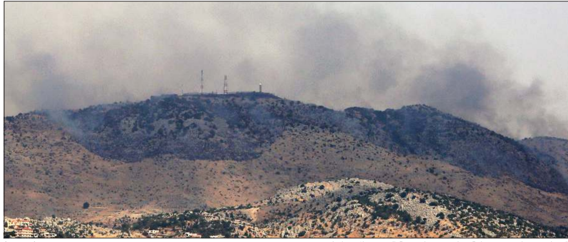
الدهان يتصاعد من منطقة مزارع شبعا نتيجة القصف الاسرائيلي