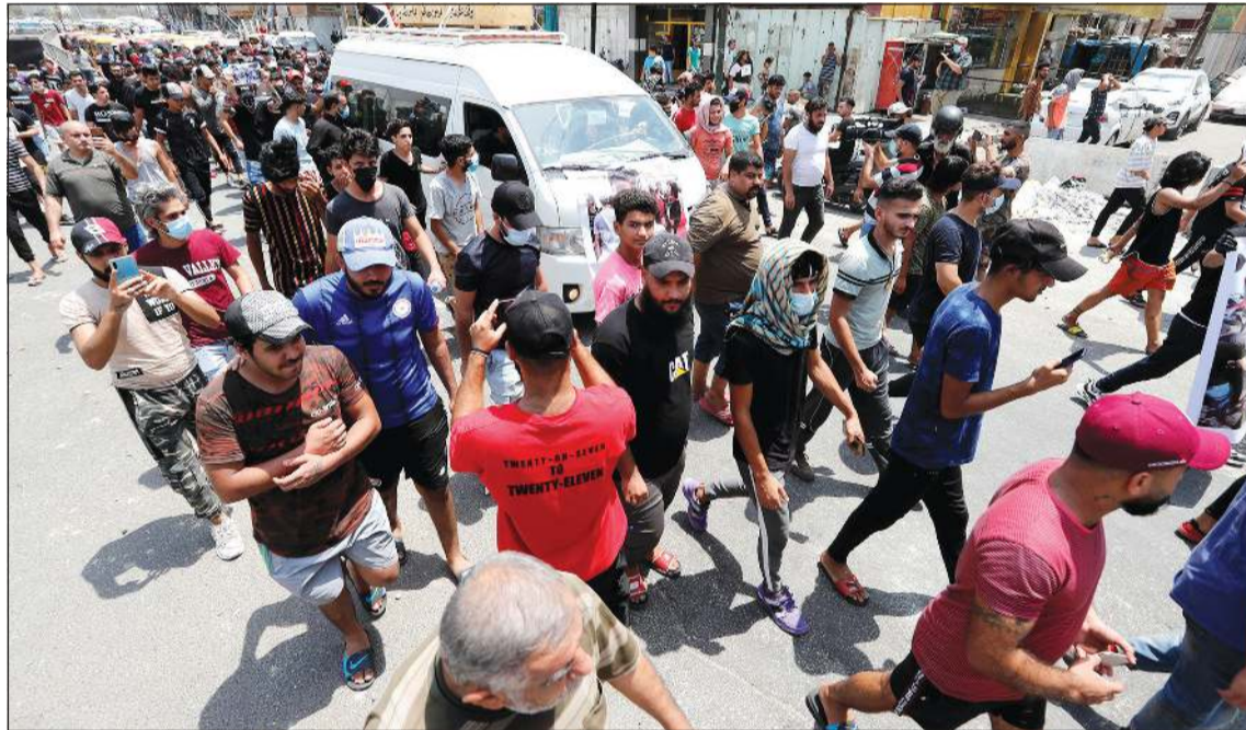
تشجيع أحد ضحايا المظاهرات في ساحة التحرير ببغداد

الأسبوع الحالي في العراق. وتعد هذه المظاهرات تقليداً صيفياً سنوياً في العراق، خصوصاً مع الانقطاع المزمّن للكهرباء، الذي لم تتمكن أي حكومة حتى الآن من إيجاد حل جذري له. واتهم العديد من الناشطين على وسائل التواصل الاجتماعي حكومة الكاظمي باتباع القمع نهجاً على غرار الحكومة السابقة. من جهتها، دانت الأمم المتحدة عمليات القمع، وقالت في بيان «نشج أعمال العنف والخسائر البشرية التي وقعت خلال احتجاجات بغداد»، داعية الحكومة إلى التحقيق ومحاسبة الجناة.