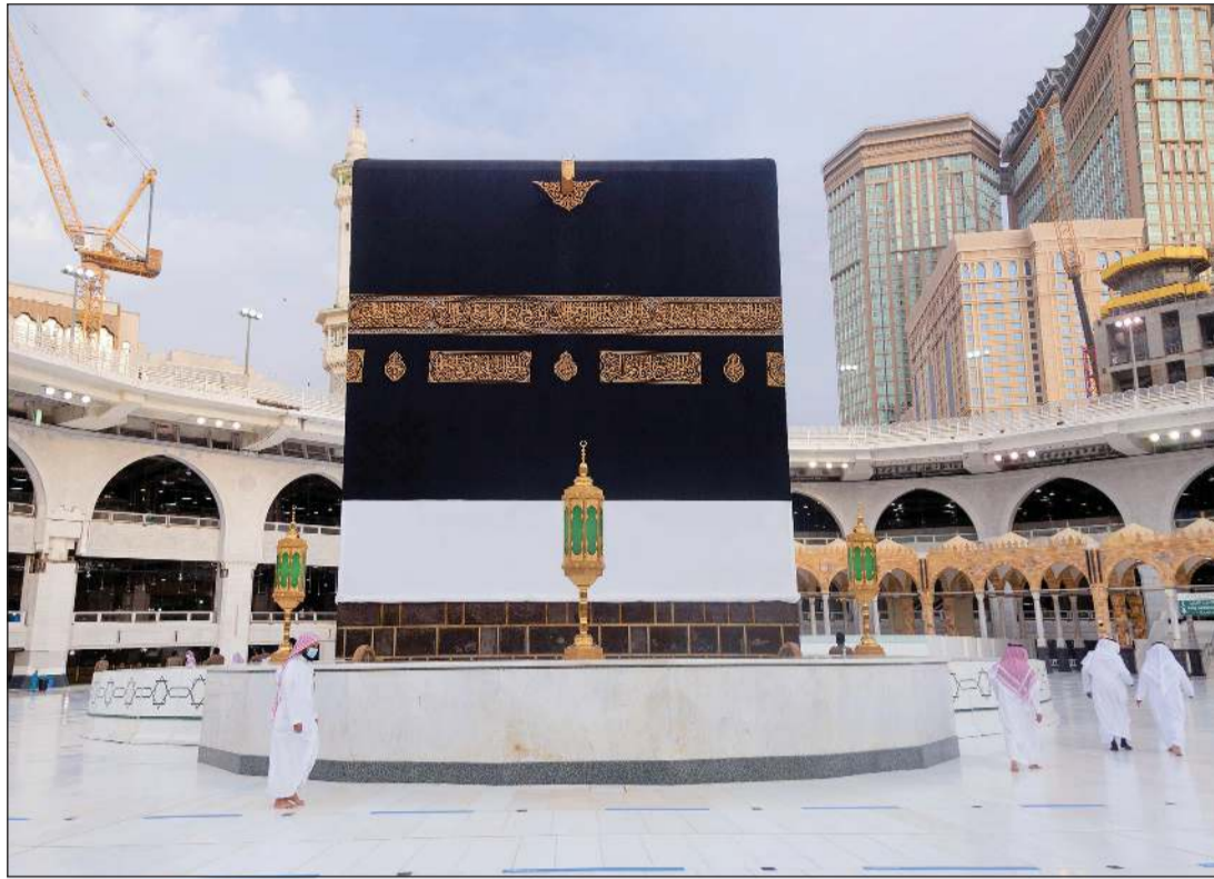
مسؤولو الحج يتفقدون التحضيرات لاستقبال حجاج بيت الله الحرام

ومنع برادات وحافظات المياه، حيث سيتم تقديم ماء زمزم المبارك من خلال عبوات معبأة ومغلقة ومعقمة ومعدة للاستخدام الواحد. وسيشارك نحو 10 آلاف مقيم من 160 جنسية تم اختيارهم إلكترونياً بنسبة 70٪ للمقيمين و30٪ للسعوديين. في المناسك التي تنطلق غداً بيوم التروية وتتواصل على مدى 5 أيام. يبدأ الحجاج بالوصول إلى مكة خلال عطلة نهاية الأسبوع، وخضوعوا لفحص لدرجة الحرارة ووضعوا في الحجر الصحي في فنادق المدينة. وتم تزويدهم بمجموعة من الأدوات والمستلزمات بينها إحرام طبي ومعقم وحصى الجمرات وكمامات وسجادة ومظلة، بحسب كتيب «رحلة الحجاج» الصادر عن السلطات. ويتوجب إخضاع الحجاج لفحص فيروس كورونا المستجد قبل وصولهم إلى مكة، وسيتعين عليهم أيضاً الحجر الصحي بعد الحج.