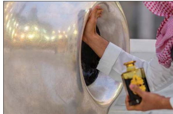
أحد الطواقم يعطر الحجر الأسود

ومنع برادات وحافظات المياه، حيث سيتم تقديم ماء زمزم المبارك من خلال عبوات معبأة ومغلقة ومعقمة ومعدة للاستخدام الواحد. وسيشارك نحو 10 آلاف مقيم من 160 جنسية تم اختيارهم إلكترونياً بنسبة 70٪ للمقيمين و30٪ للسعوديين. في المناسك التي تنطلق غداً بيوم التروية وتتواصل على مدى 5 أيام. يبدأ الحجاج بالوصول إلى مكة خلال عطلة نهاية الأسبوع، وخضوعوا لفحص لدرجة الحرارة ووضعوا في الحجر الصحي في فنادق المدينة. وتم تزويدهم بمجموعة من الأدوات والمستلزمات بينها إحرام طبي ومعقم وحصى الجمرات وكمامات وسجادة ومظلة، بحسب كتيب «رحلة الحجاج» الصادر عن السلطات. ويتوجب إخضاع الحجاج لفحص فيروس كورونا المستجد قبل وصولهم إلى مكة، وسيتعين عليهم أيضاً الحجر الصحي بعد الحج.