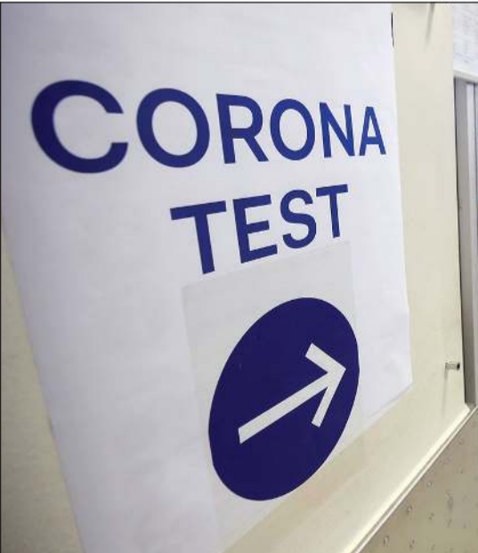
مساغرون ينتظرون لاجراء فحص «كورونا» في مطار دوسلدورف بألمانيا

وقالت الرئاسة الأميركية في بيان إن أوبراين الذي يتولى منصباً رئيسياً في الإدارة يخضع للعزل الذاتي ويعمل «من مكان آمن» خارج البيت الأبيض، لافتة إلى أنه «لا خطر لإصابة الرئيس أو نائب الرئيس». نقلت من جهتها، «بلومبيرغ» إن أوبراين لم يتواجد في مكتبه منذ نهاية الأسبوع الماضي. وأضافت إن إصابة أوبراين جاءت عقب حضوره فعالية أسرية. في هذه الأثناء، قال المدير العام لمنظمة الصحة، تيدروس أدهانوم غيبريسوس، في مؤتمر صحافي: «من الواضح