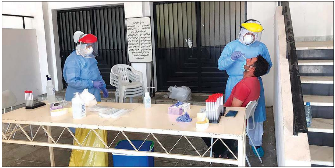
جانب من إجراءات فحص كورونا اللبنانيين في بلدية دير إنطار في صور

فقد سجل أمس الأول أعلى نسبة إصابات بكورونا في لبنان، حيث بلغت 173 إصابة، ليرتفع العدد التراكمي إلى 3579 حالة. وزير الصحة د.حمد حسن، تحدث من بعلبك منتقداً المواطنين الذين لا يلتزمون بالحذر، عن قلة وعي ودراية بالخطر المائل، متحدثاً عن إجراءات مشددة، ليس من بينها إعادة إقفال المطار، أما وزير الداخلية محمد فهمي فقد كان أكثر صراحة عندما قال في تصريح تلفزيوني انه يريد التوازن بين الوضع الاقتصادي والظرف الصحي الراهن، لافتاً إلى ان الأمر الأسهل هو إغلاق كل البلد، لكن الوضع الاقتصادي لا يتحمل المزيد من النكسات، وأعدا بإجراءات يتخذها غداً في ضوء تقرير الأمن العام عن الأوضاع في مراكز السياحة والمنتجعات البحرية. وقال فهمي: الوضع سيئ وأسوأ من سيئ، ومن الآن وحتى 15 أغسطس، إذا