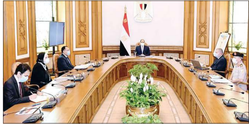
جانب من اجتماع الرئيس عبد الفتاح السيسي مع رئيس الحكومة وعدد من الوزراء والمسؤولين