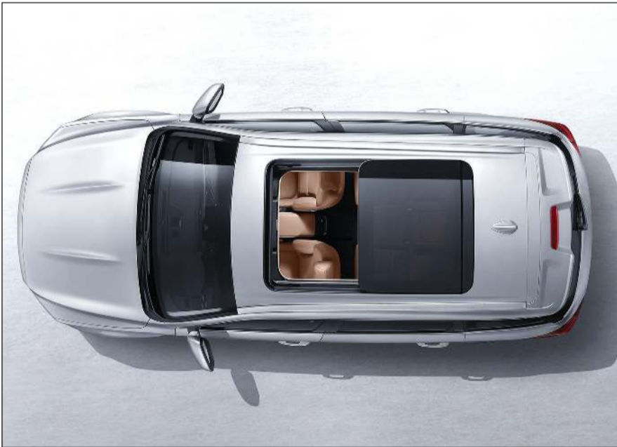
فتحة سقف بانورامية

ومع أسعار تبدأ من 5750 ديناراً، تأتي «أزكارا» بكفالة مذهلة مدتها 15 سنة، مما يشكل خيراً شهادة على ثقة جيلي بجودة سياراتها، فضلاً على باقية صيانة لمدة 3 سنوات وتسجيل بالمرور، فينال كل عميل قيمة مضافة ممتازة. وتزداد روعة تجربة الملكية لسيارة «أزكارا» بفضل منشأة مخصصة للخدمة وقطع الغيار، مما يؤمن تجربة متكاملة لخدمة ما بعد البيع تمنح مالكي سيارات جيلي راحة البال والطمأنينة الكاملة. سيارة جيلي «أزكارا» الجديدة كلياً متاحة الآن للتجربة في صالة جيلي الغانم في منطقة الري.