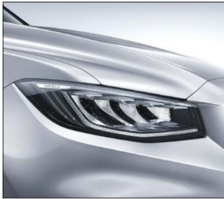
مصباح أمامية ديناميكية LED ماسية