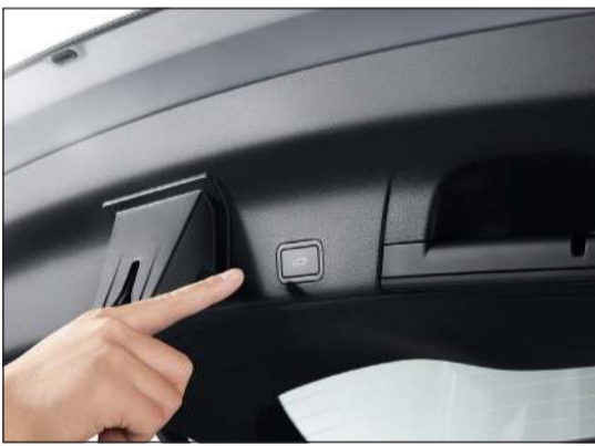
باب خلفي كهربائي