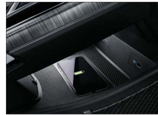
شحن لاسلكي ذكي