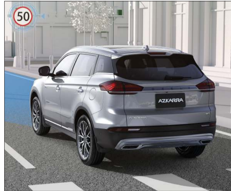
نظام معلومات حدود السرعة