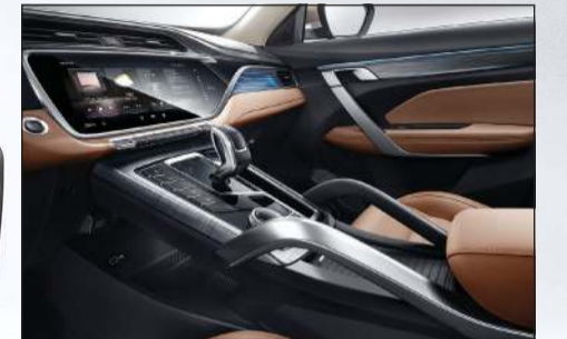
شاشة ترفيه عالية الوضوح قياس 12,3 بوصة تعمل باللمس

■ «أزكارا» تمثل عزم «جيلي أوتو» على تصدر الريادة في مجال السيارات الذكية والمركبات الرياضية رباعية الدفع الراقية