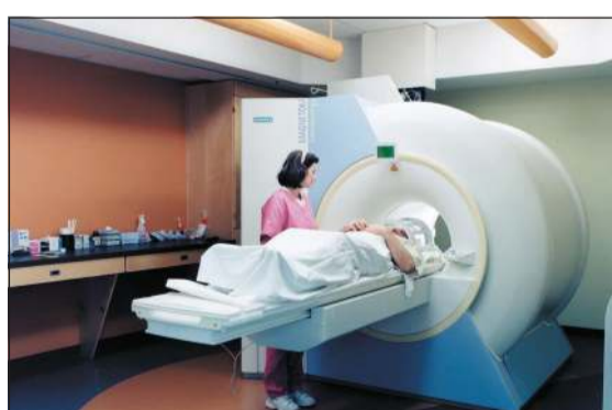
الأشعة المقطعية تسهم في تشخيص المرض

العصبي تستخدم لتعديل جهاز المناعة، حيث تقوم بتثبيتها وتعديلها للمستوى الطبيعي، وبعض الأدوية تخفض جهاز المناعة إلى أقل من اللازم. وعن فيروس كورونا المستجد ومرض ms قال إن أي مرض بالتصلب العصبي إنسان عادي طالما لا يكون تحت العلاج لجهاز المناعة الخاص به يكون طبيعياً في التعامل مع الفيروس، وليس هناك دليل علمي على تعرضهم بنسبة أعلى للإصابة بالفيروس وأعلى نسبة يصابون به بعد أخذ دواء واحد واستغنى دواء واحداً يتطلب من المرضى توخي الحذر وهو «المتوزيماب»، حيث يخفض المناعة بشكل كبير وخاصة خلال الشهر الأول وهنا يكون المريض معرضاً للفيروسات فننصحه مرضاً للفيروسات بعد الكورس لمدة شهر وبشكل عام نحاول حل المرض على التعامل مع «كورونا» كشخص طبيعياً مع الالتزام بالأدوية وعدم إيقافها، ونناشد المرضى إتخاذ الاحتياطات الوقائية لسلامتهم وعدم الخروج إلا للضرورة وارتداء الكمام