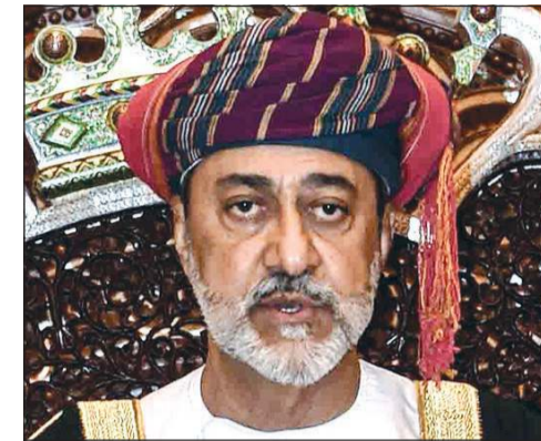
السلطان ميثم بن طارق

بحفظه الله ورعايته، وصل صاحب السمو الأمير الشيخ صباح الأحمد، حفظه الله ورعاه، إلى الولايات المتحدة الأميركية الصديقة وهو بحالة صحية مستقرة ولله الحمد وذلك لاستكمال العلاج.