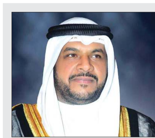
الشيخ أحمد المنصور

حفظه الله ورعاه من احترام وتقدير دولي رفيع. وقد أعرب سمو نائب الأمير وولي العهد الشيخ نواف الأحمد، حفظه الله، عن بالغ الشكر والتقدير على ما أبداه صاحب السمو الملكي الأمير تشالز أمير ويلز وولي عهد المملكة المتحدة الصديقة من مشاعر طيبة وتمنيات صادقة، منوهاً سموه بالعلاقات التاريخية والوطيدة التي تربط الأسترلين والبلدين والشعبين الصديقين، متمنياً لسموه دوام الصحة والعافية. كذلك تلقى سمو نائب الأمير وولي العهد الشيخ نواف الأحمد، حفظه الله، برقية من رئيس المجلس الرئاسي ورئيس حكومة الوفاق الوطني في دولة ليبيا الشقيقة فايز السراج اطمأن خلالها على صحة صاحب السمو الأمير الشيخ صباح الأحمد، حفظه الله ورعاه، متمنياً لسموه رعاه الله دوام العافية. هذا، وبعث سمو نائب الأمير وولي العهد الشيخ نواف الأحمد، حفظه الله ببرقية شكر جوابية إلى السراج أعرب فيها عن بالغ شكره وتقديره على ما أبداه من طيب المشاعر وصادق الدعاء، متمنياً سموه له موفور الصحة والعافية.