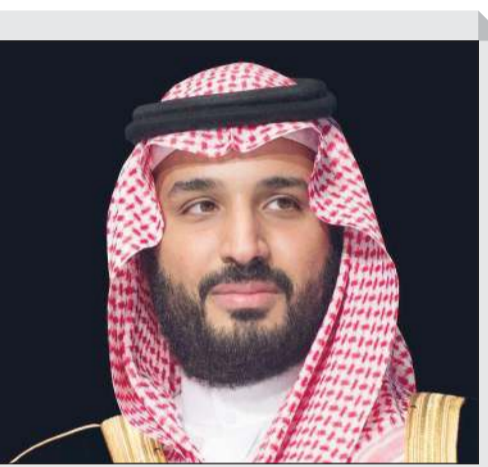
صاحب السمو الملكي الأمير محمد بن سلمان

طيب المشاعر وصادق الدعاء، مقدراً سموه هذا التواصل الأخوي الذي يعكس عمق أواصر العلاقات التاريخية والوطيدة التي تربط البلدين والشعبين الشقيقين، متمنياً لجلالته موفور الصحة وتتمام العافية وللشعب العماني الشقيق كل الرفعة والأزدهار. كذلك تلقى سمو نائب الأمير وولي العهد الشيخ نواف الأحمد، حفظه الله ورعاه، اتصالاً هاتفياً من أخيه صاحب السمو فهد بن محمود آل سعيد نائب رئيس مجلس الوزراء