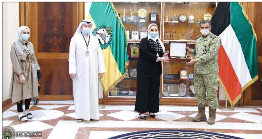
دور تكريمية تقديراً للجهد البذلة

تقدم القائم بالأعمال في سفارة إريتريا بالكويت حمد يحيى حالي باسمه وباسم أعضاء السفارة والجالية الإريترية بالكويت، إلى مقام صاحب السمو الأمير الشيخ صباح الأحمد بأصدق عبارات التهنئة والتبريكات لنجاح العملية الجراحية التي أجريت لسموه،