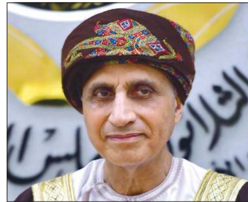
صاحب السمو فهد بن محمود آل سعيد