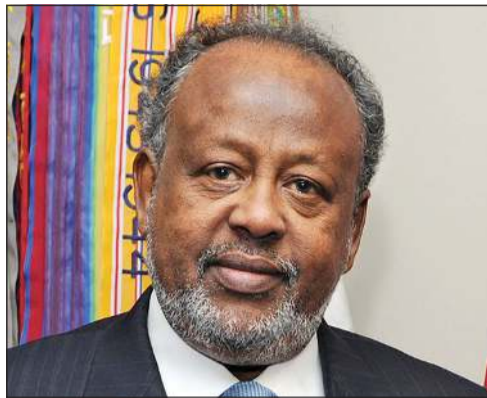
الرئيس إسماعيل عمر جيله