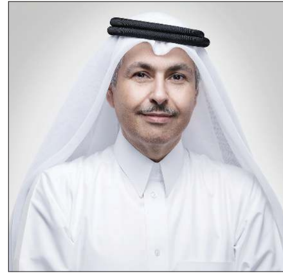
الشيخ سعود بن ناصر آل ثاني

وتابع بالقول: «تأثرت أعمالنا بجائحة كورونا نتيجة للقيود على الحركة وإقبال مؤسسات البيع بالتجزئة وأدى ذلك لتغيرات في أنماط الاستهلاك لدى العملاء وتحولت كافة استخدامات الهواتف النقالة ذات التكلفة إلى خدمات الخطوط الثابتة الشاملة، وكانت النتيجة أن إيرادات الشركة الوطنية للاتصالات المتنقلة بلغت 294,1 مليون دينار خلال النصف الأول بتراجع بنسبة 5٪، عما