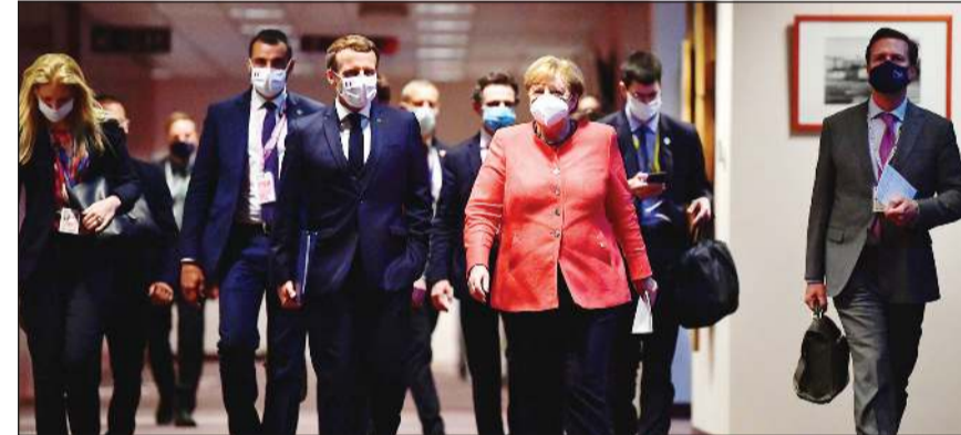
المستشارة الألمانية أنجيلا ميركل والرئيس الفرنسي إيمانويل ماكرون خلال حضورهما القمة الأوروبية في بروكسل

أ.ف.ب: في ختام قمة ماراثونية استمرت 4 أيام وسادها توتر شديد، توصلت القادة الأوروبيون إلى 27 أمسا إلى خطة تاريخية لدعم اقتصادات دولهم المتضررة جراء وباء كورونا، تمول لأول مرة بواسطة دين مشترك. وتم الاتفاق على الحزمة البالغة قيمتها الإجمالية 750 مليار يورو بعد مفاوضات مكثفة وشاقة لوح خلالها رئيس الوزراء المجري بفرس فيتو، وقاومت لاهاي وفيينا بعناد خطة شديدة السخاء بنظرهما، فيما رفع الرئيس الفرنسي إيمانويل ماكرون النبرة غاضبا. وأعلن ماكرون خلال مؤتمر صحفي مع المستشار الألمانية «تم تخطي مرحلة هامة» فيما رأت أنجيلا ميركل التي تتولى بلادها حاليا الرئاسة الدورية للتكتل أن الاتفاق «رد على أكبر أزمة يواجهها الاتحاد الأوروبي منذ إنشائه». كما أثنى رئيس الوزراء الإسباني بيدرو سانشيز خلال مؤتمر صحفي منفصل على «خطة عظيمة لأوروبا» معتبرا أنها «خطة مارشال