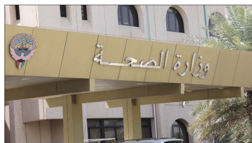
جميع قطاعات الوزارة مطالبة بوضع خطة دقيقة التقديرات

وتوربينات - مضخات ومكابس ميكانيكية - معدات خاصة - تنظيم مرور). شؤون التخطيط والجودة وجاء في المشروع أن تقوم إدارة التخطيط والمتابعة والتنسيق مع الجهات المسؤولة بالوزارة بتنفيذ برامج عمل الحفلات الرسمية المتوقع لإقامتها والهدايا والدروع وإعداد الدراسة عن بند حفلات وضيافة للسنة المالية 2021 - 2022 والسنوات التالية كخطة استرشادية وإرساله إلى وزارة المالية في الموعد المحدد كما تقوم لجنة المؤتمرات بإعداد بيان تفصيلي لقطع غير تجهيزات وورش العمل التي سوف تعقد خلال السنة المالية 2021 - 2022 لجنود المؤتمرات وورش العمل وإرسالها إلى وزارة المالية في الموعد المحدد، بالإضافة إلى أن إدارة نظم المعلومات تقوم بتقدير احتياجات قطاعات الوزارة من نظم تقنية المعلومات وموافاة الجهاز المركزي لتكنولوجيا المعلومات في المواعيد المحددة باحتياجات الوزارة من نظم