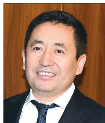
سفير كازاخستان دولت يمبردييف

بالأصالة عن نفسي وبالنيابة الشعب الكازاخستاني نرفع أسمى آيات التهاني والتبريكات لمقام صاحب السمو الأمير بمناسبة نجاح العملية الجراحية التي أجريت لسموه مؤخراً، متمنين لسموه موفور الصحة ودوام العافية، سائلين المولى عز وجل أن يديم على الكويت وشعبها نعمة الاستقرار تحت القيادة الحكيمة لصاحب السمو الأمير.