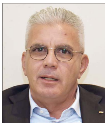
السفير الفلسطيني رامي طهبوب