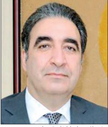
سفير أذربيجان إيلخان أليخان قهرمان