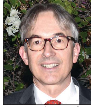
السفير السويسري بينديكت غوبلر