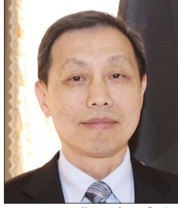
السفير الصيني لي مينغ قانغ