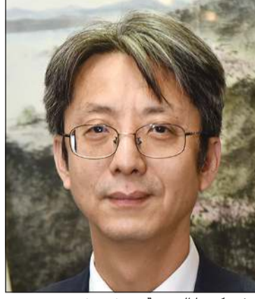
سفير كوريا الجنوبية هونغ يونغ جي