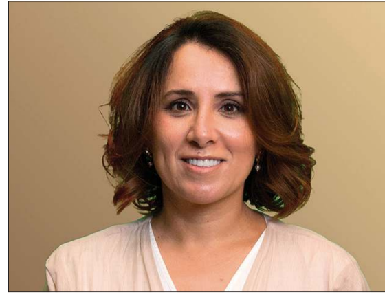
الشيخة دانة ناصر الصباح