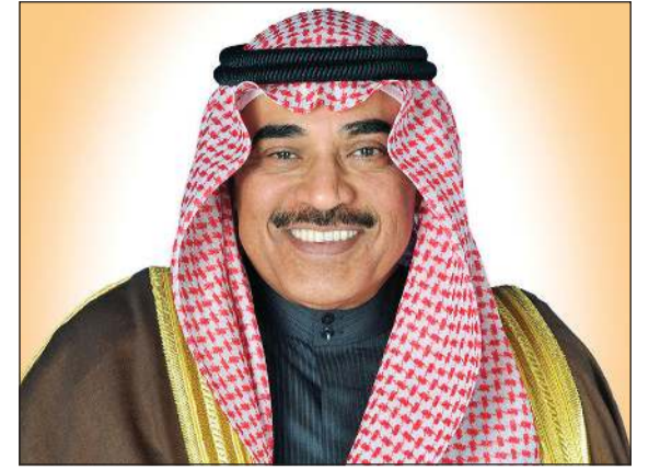
سمو رئيس الوزراء الشيخ صباح خالد

الجامعة احتفلت بتخريج دفعة 2020 تحت رعاية رئيس الوزراء