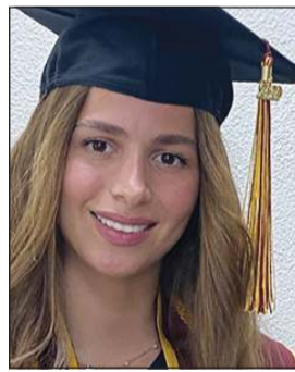
الأميرة سارة كحكي