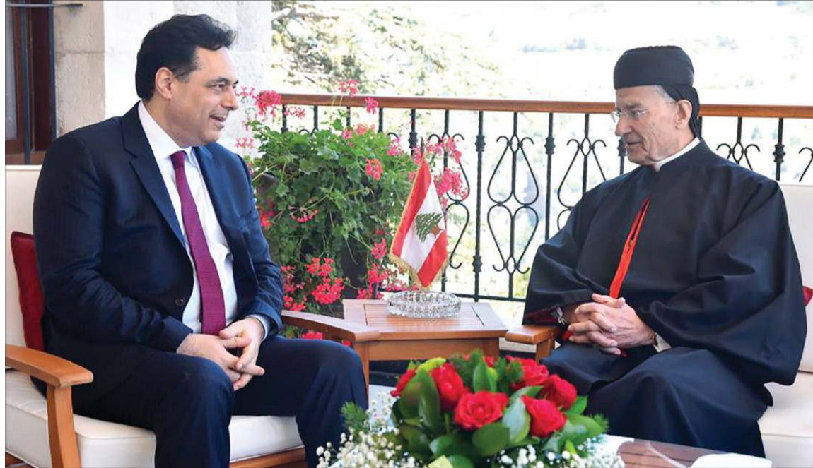
البطريك الماروني بشارة الراعي خلال لقائه رئيس الحكومة حسان دياب في الديمان (محمود الطويل)

سجل فيها فهمه لمعادلة لبنان المستقل في مذكراته، حيث يقول الرئيس الخوري: «دفعنا عن أنفسنا تهمة العزلة والانزعال، وتلفنا إلى العرب الذين تجمعنا وإياهم رابطة اللغة والعادات والأخلاق الشريفة.. فأصبح اللبنانيون شخصاً واحداً، لبنانياً قومياً، استقلالياً عربياً». وأصل وحزب الله، انتقد عبر مواقع التواصل الاجتماعي، البطريك الراعي بقوة فيما وصفه مؤيدوه كلامه عن هيمنة حزب الله على السلطة - و«مجد لبنان اعطى له».