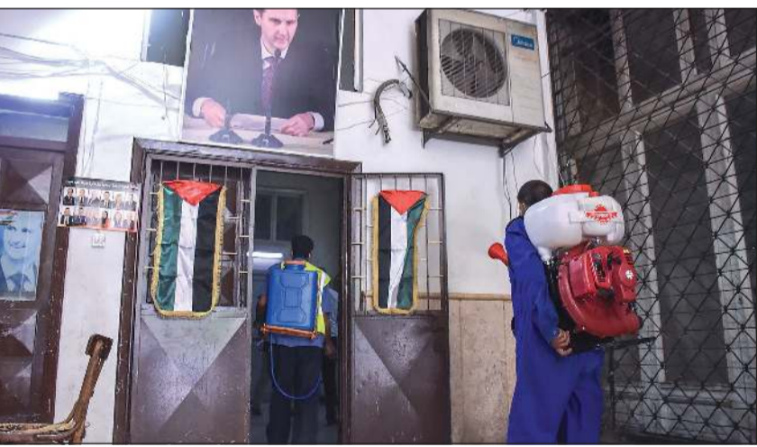
عمال بلدية يطهرون أحد مراكز الاقتراع في حلب