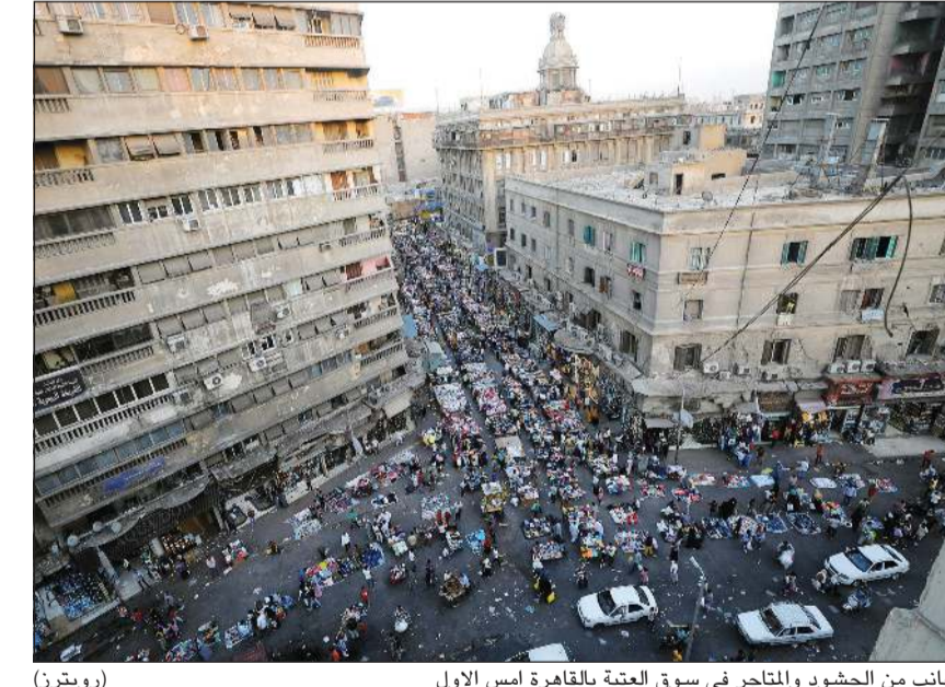
جانب من الحشود والمتاجر في سوق العتبة بالقاهرة أمس الاول

وأشار عراق - في كلمته بمنتهى الإعلام حول تغطية انتخابات مجلس الشيوخ المقام في ماسبيرو أمس - إلى أن هناك 17 ألف لجنة فرعية، قائلاً «استفدنا من أجهزة التعقيم التي استخدمت في الانتخابات الخاتوية العامة، وسيتم استخدامها في المدارس التي بها لجان كما سيتم تعقيم اللجان 3 مرات يومياً قبل التصويت وأثناء الراحة وبعد التصويت وتوفير مسافات بين الناخبين». وناشد عراق المواطنين عدم العزوف عن التصويت بسبب فيروس كورونا المستجد، مشاشدا إياهم باستخدام حقهم في التصويت. وفي سياق متصل، تبدأ محكمة القضاء الإداري بمجلس الدولة اليوم، تلقي الطعون الانتخابية من المرشحين لخوض انتخابات مجلس الشيوخ، وذلك وفقاً للمواعيد التي حددتها الهيئة الوطنية للانتخابات برئاسة المستشار لاشين إبراهيم. وقالت الهيئة الوطنية للانتخابات إن القضاء الإداري وفقاً لاختصاصه بنظر طعون المستبعدين من خوض انتخابات مجلس الشيوخ مقرر له تلقي تلك