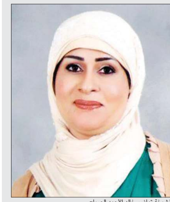
الشيخة تامضر خالد الأحمد الصباح