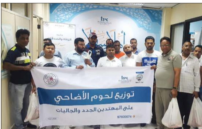
توزيع الأضاحي على المسلمين الجدد داخل الكويت

تستقبل جمعية النجاة الخيرية حالياً تبرعات المحسنين لتنفيذ مشروع الأضاحي والذي يعد واحداً من أهم المشاريع الموسمية التي تسعى النجاة الخيرية ولجانها إلى تنفيذها داخل الكويت وخارجها لتلبية لرغبات المنبرين، وتحرص الجمعية على اختيار الدول الأشد احتياجاً وتبدأ قيمة التبرع للأضاحي خارج الكويت من 22 ديناراً للضأن و70 ديناراً للأبقار. وما لاشك فيه فإن مشروع الأضاحي هذا العام 1441 هـ يأتي والعالم يواجهه جانحة كورونا التي تسببت في زيادة معدلات الفقر والجوع وارتفاع نسبة البطالة حول العالم، ما ساهم في مضاعفة أعداد المستفيدين من شريحة العمالة التي تركت وظائفها بجانب الفقراء والأيتام والأرامل وذوي الدخل المحدود. مما بدوره يحتم علينا خلال هذا المشروع الموسمي مضاعفة الجهود من أجل إسعاد هؤلاء البسطاء في هذه الأيام المباركة.