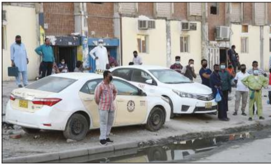
غياب التاكسيات يمنعها من زيارة ابنها