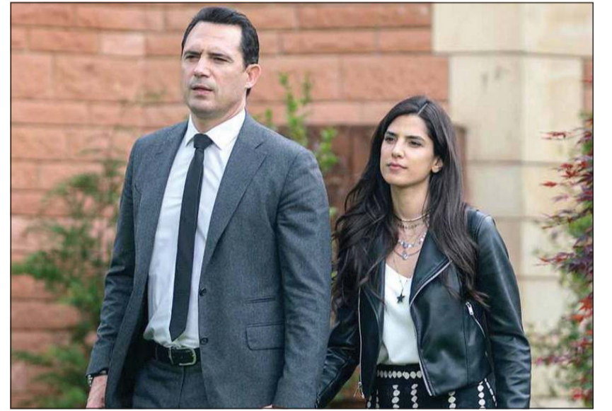
ظافر العابدن وكارمن بصيص في مسلسل «عروس بيروت»