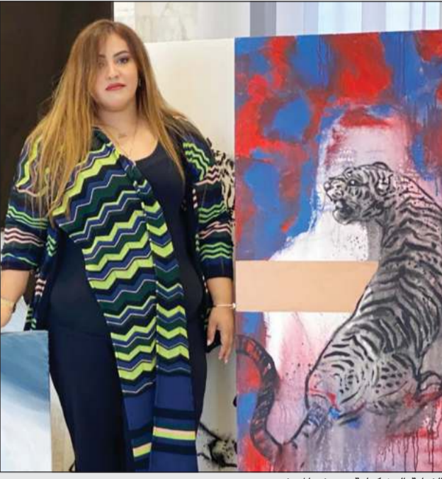
الفنانة التشكيلية منوف المنيفي