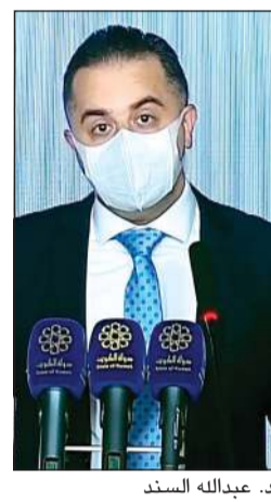
د. عبدالله السندي

السفر. وقال ان 99% من الحالات النشطة تعاني من اعراض خفيفة، فيما 1% من الحالات والمقدرة بنحو 60 ألف حالة في وضع حرج، وأن 3 إلى 5 آلاف حالة وفاة يوميا عالميا.