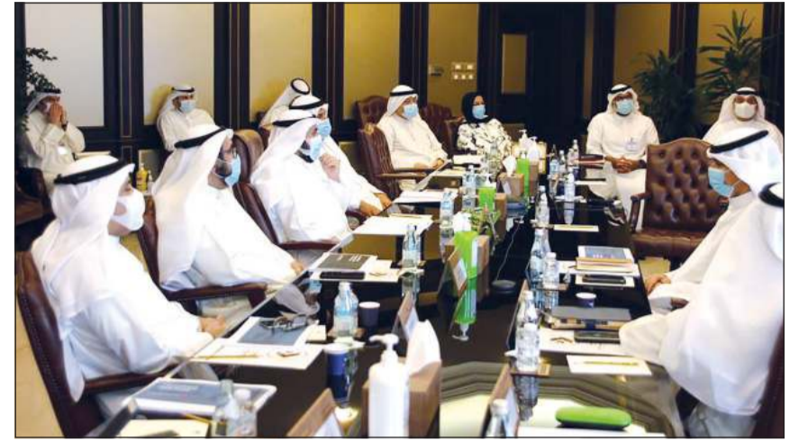
الشيخ دباسل الصباح والشيخ سلمان الحمود خلال الاجتماع

استعرضت برئاسة رئيس الإدارة العامة للطيران المدني الشيخ سلمان الحمود الصباح الدليل الإرشادي لبدء التشغيل التجاري في ضوء جائحة كورونا (كوفيد 19).