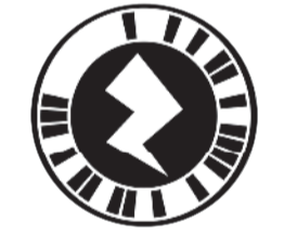
حمل تطبيق Zappar