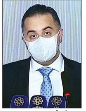
د. عبدالله المسند

في مؤشر جديد يدعو للخفاؤل، عادت الإحصائيات لتبشر بالخير حيث ارتفع عدد حالات التعافي عن الإصابات الجديدة بـ 746 إصابة من مرض (كوفيد-19) في الـ 24 ساعة الماضية ليرتفع إجمالي حالات الشفاء من المرض في الكويت إلى 45356 متعافياً، كما أعلنت الوزارة تسجيل 614 إصابة جديدة بـ «كورونا» ليبلغ إجمالي الإصابات إلى 50558 إصابة، كما سجلت 3 حالات وقفاة جديدة ناتجة عن مضاعفات الإصابة بالوباء خلال الـ 24 ساعة الماضية ليصبح إجمالي الوفيات المسجلة في البلاد 393 وقفاة. وذكرت الوزارة في البيان الإحصائي اليومي أن الإصابات الجديدة بمرض «كوفيد 19»، جاءت لحالات مخالطة لحالات مصابة بالمرض وحالات أخرى قيد البحث عن أسباب العدوى وفحص المخالطين لهم، لافتة إلى تسجيل 378 حالة مواطنين كويتيين، و236 حالة من جنسيات أخرى. وذكرت «الصحة» أن حالات التعافي الجديدة بلغت 746 حالة من المصابين بالمرض، ليرتفع بذلك عدد الحالات التي تعافت وتماثلت للشفاء في البلاد إلى 45356 حالة.