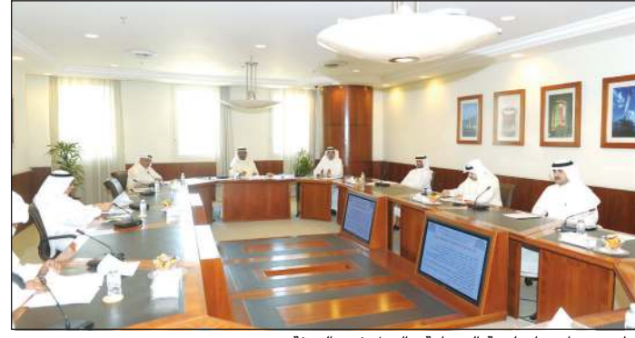
جانب من اجتماع لجنة الصناعة والعمل في «الغرفة»

بحثها وتناولها خلال الفترة القادمة واتخاذ السبل اللازمة لتحقيق طموحات أصحاب العمل بشأنها، وتفقت اللجنة على السعي لدى الجهات المعنية لتسريع تنفيذ منطقة التعميم الصناعية، وتعزيز التوجهات الحالية لدى الهيئة العامة للصناعة لتقديم حوافز لتنمية الصادرات الصناعية الكويتية، والإسراع نحو إصدار اللائحة التنفيذية للقانون رقم 79 لسنة 2019 بتعديل بعض أحكام القانون رقم (49) لسنة 2016 بشأن المناقصات العامة بما يدعم المنتج المحلي بصورة عامة والمشروعات الصغيرة والمتوسطة على وجه الخصوص، وتسهيل بيئة عمل القطاع الصناعي من خلال تنفيذ المادة (29) من القانون 1996/56، بحيث تختص الهيئة العامة للصناعة باللجنة أعضائها لتطوير القطاع الصناعي.