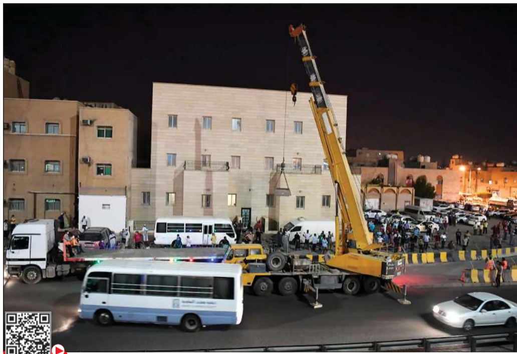
جانب من عمليات إزالة الحواجز الاستثنائية في منطقة الجليب تمهيداً لرفع العزل

قبل ساعات من انتهاء عزل منطقة جليب الشيوخ اعتباراً من اليوم الخميس تنفيذاً لقرار مجلس الوزراء، قامت آليات وزارة الأشغال برفع الحواجز الاستثنائية التي كانت متواجدة بالمنطقة منذ السادس من إبريل الماضي.