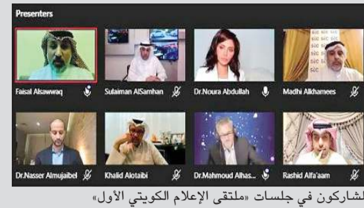
المشاركون في جلسات «ملتقى الإعلام الكويتي الأول»