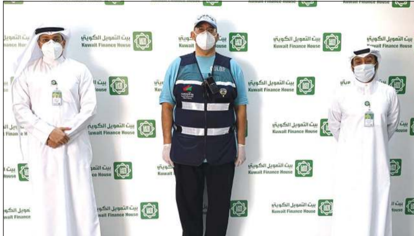
ممثل وزارة التجارة والصناعة مع فريق «بيتك» على هامش السحب

خلال الأشهر الثلاثة التي تسبق السحب، وألا يقل عن 50 ديناراً في نهاية كل شهر خلال الأشهر الثلاثة التي تسبق السحب، حيث إن كل 50 ديناراً إضافية في الحساب تزيد فرص العميل في الربح، وبذلك يعتبر حساب «الرابح» بمنزلة جوائز، مناسبة للعملاء الراغبين في تحويل رواتبهم، وإدارة حساباتهم الشخصية، مع إمكانية الادخار والاستثمار. ويؤكد حساب «الرابح» حرص «بيتك» المتواصل لتقديم منتجات متميزة تلبي طموحات العملاء، وتمنحهم تجربة مصرفية استثنائية.