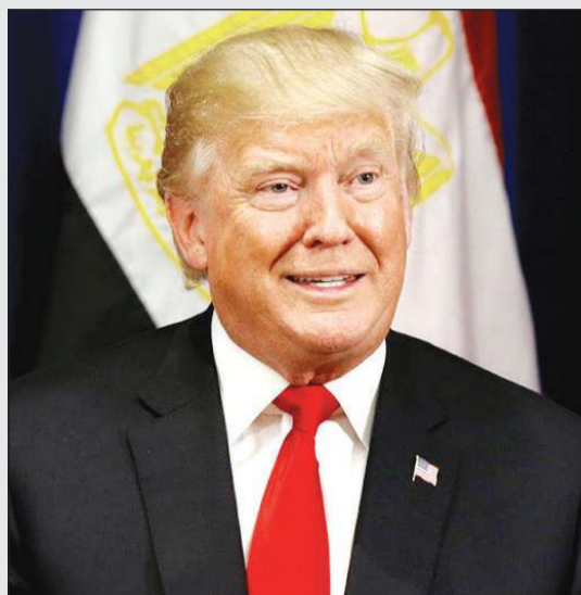
الرئيس الأميركي دونالد ترامب