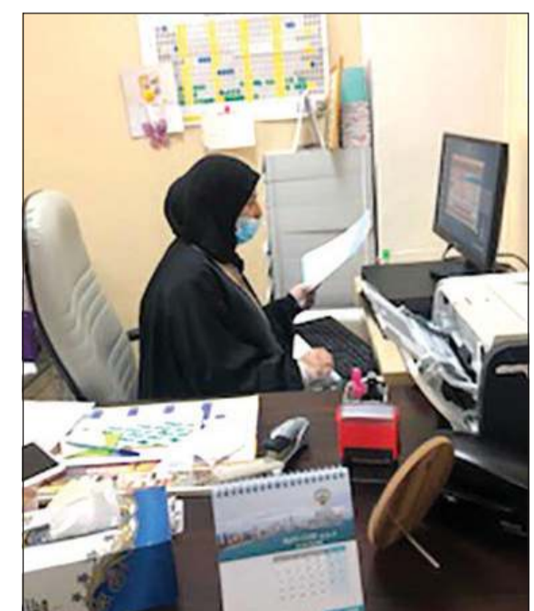
الموظفون على رأس عملهم

الوزارة بنسبة حضور الموظفين المحددة من قبل مجلس الوزراء. وأضاف الحمدان: الاستعدادات جارية على قدم وساق لاستقبال المراجعين وفق موعد مسبق وللضرورة من بداية الأسبوع المقبل في القطاعات والإدارات ذات العلاقة مع الجمهور، وكما شاهدتهم الإرشادات ولوازم الوقاية في الممرات وامام المكاتب والأعمال تسير بكل سلاسة ولا يوجد تأخير في الإجراءات والموظفون يبذلون أقصى الجهود لإنجاز الأعمال رغم العدد القليل والحمد لله وزارة الشؤون استطاعت تجاوز كل الصعوبات خلال أزمة كورونا، ونتمنى أن تنتهي عاجلا والجميع بخير وسلامة.