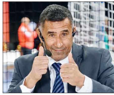
المحاضر الدولي نبيل طه

اللياقة البدنية أثناء فترة الإبتعاد عن الصالات والدخول في التدريبات الجماعية للمنتخبات الوطنية، مضيفاً أن على الجميع حالياً الاجتهاد في رفع مستوى اللياقة البدنية وزيادة الكتل العضلية، بالإضافة إلى الاهتمام بالجانب الذهني أيضاً.