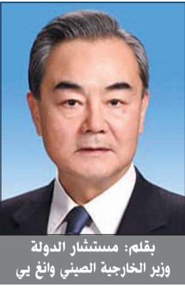
بقله: مستشار الدولة وزير الخارجية الصيني وانغ بي

السلم والاستقرار في المنطقة. ثانياً: تعززت المواءمة بين الاستراتيجيات التنموية من خلال ربط طموحات النهضة بشكل وثيق. ووقعت 19 دولة عربية وجامعة الدول العربية مع الصين على وثائق التعاون في بناء «الحزام والطريق»، وأنشأ عدد متزايد من الدول العربية آليات اللجان الرفيعة المستوى مع الصين، وأصبحت المواءمة بين الاستراتيجيات التنموية للجانبين أكثر دقة وفاعلية. وتم استحداث 17 آلية تعاون في إطار منتدى التعاون الصيني - العربي، وشارك أكثر من 2300 ممثل من الأساط المختلفة