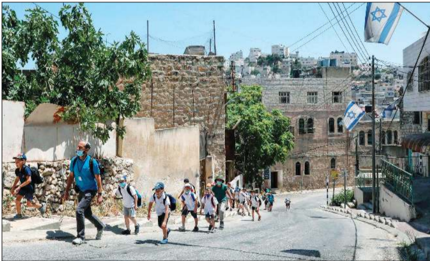
مستوطنون إسرائيليون وأطفال يسيرون في أحد شوارع مدينة الخليل في الضفة

كورونا المستجد. في هذا السياق، يرى 5/ فقط من الإسرائيليين أن الضم يجب أن يكون أولوية الحكومة، وفقاً لاستطلاع أجره أبحاث في القدس «قد يتساءل المرء، في هذه الحالة، لماذا سيرود نتنياهو لمشروع إذا كان اهتمام الرأي العام في هذا الموضوع ضعيفاً». واعتبر بليسنر أن «التفسير الأول في هذا الصدد هو رغبة رئيس الوزراء المخضرم بالتحرك إلى الأمام لتحويل الأنظار عن محاكمة الفساد المفتوحة ضده في النيابة العامة»، التي بدأت في مايو وينكر فيها ارتكاب أي مخالفات. والتفسير الثاني قد تكون رغبة نتنياهو البالغ من العمر 70 عاماً بتعزيز إرثه كرئيس وزراء إسرائيلي.