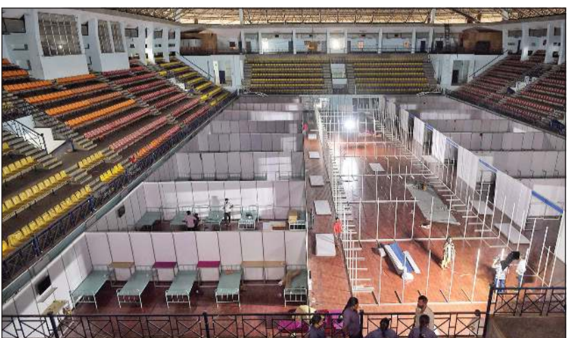
عمال يحولون صالة رياضية إلى مستشفى ميداني في بتغالور بعد ارتفاع قياسي لاصابات كورونا في الهند

كورونا «أبعد ما يكون من نهايته» وعلى العالم التصرف دون انتظار لقاح