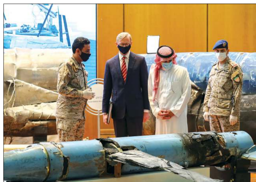
عادل الجبير وبرابن هوك يطلعان على بقايا صواريخ باليستية وأسلة أطلقها متطرفون حوثيون على الرياض

في سياق آخر، استعرض ترامب، الذي تراجع عن شعبيته في استطلاعات الرأي، فوزه في انتخابات العام 2016 قائلا إنه مقتنع بأن التاريخ سيعيد نفسه في انتخابات نوفمبر. وكتب ترامب في تغريدة: «أسف لإبلاغ الديموقراطيين الذين لا يفعلون شيئا، بأن لدي أرقاما جيدة جدا من استطلاعات رأي داخلية»، من دون إيضاحات أخرى بشأن الأعداد التي في حوزته. التفاصيل ص 21