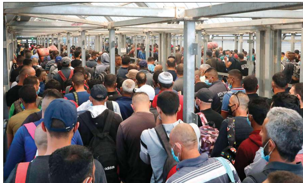
عمال فلسطينيون ينتظرون الدخول الى اسرائيل عند حاجز المطار في الخليل

الاول من يوليو حيث تعترض إسرائيل بدء تنفيذ الضم، يوم غضب شعبي رفضاً لقرار الضم». من جهته، دعا عضو المكتب السياسي للجبهة الشعبية لتحرير فلسطين جميل مزهر إلى اجتماع عاجل للأمناء العاملين للفصائل الفلسطينية للاتفاق على قرارات مشتركة في مواجهة مخطط الضم الإسرائيلي. وأكد مزهر أن «المسؤولية الوطنية تتطلب التأكيد على جدتها لمواجهة مشاريع الضم» من خلال استعادة الوحدة الوطنية، داعياً منظمة التحرير إلى سحب اعترافها بإسرائيل كخطوة استراتيجية جامعة لمواجهة التحديات. وفي السياق ذاته، أكد عضو المكتب السياسي لحركة الجهاد الإسلامي نافذ عزام أن الخروج من حالة الانقسام (الفلسطيني الداخلي المستمر منذ منتصف عام 2007) خطوة مهمة لمواجهة مخطط الضم الإسرائيلي. وحث عزام على ضرورة دعوة الأمناء العاملين للفصائل لاجتماع مشترك باعتبار ذلك «خطوة حقيقية لتثبيت للعالم أننا موحدون، على طريق استعادة وحدة الموقف الوطني».