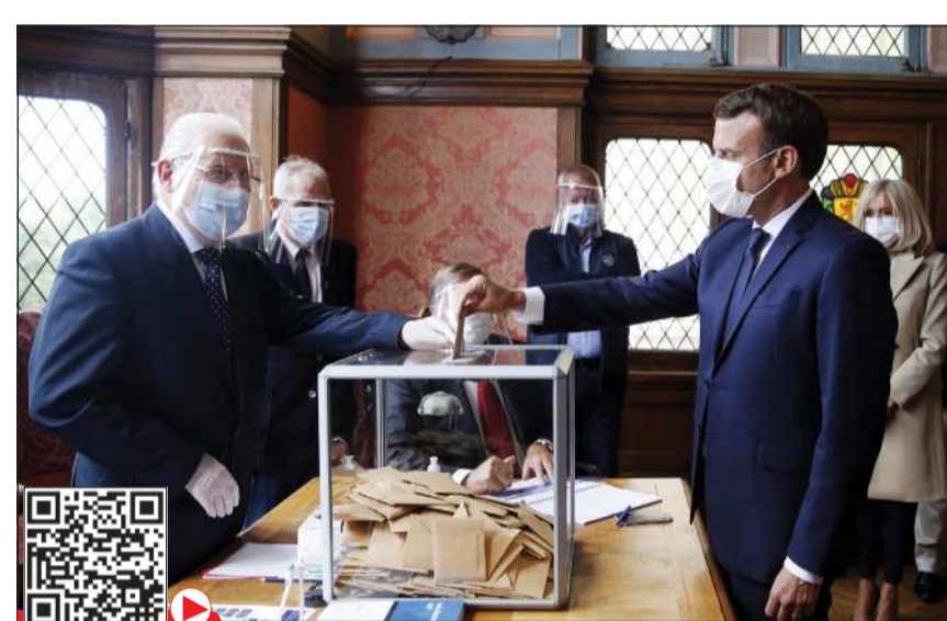
الرئيس الفرنسي إيمانويل ماكرون خلال الإللاء بصوته في الانتخابات البلدية أمس

عواصم - وكالات: أدلى الناخبون الفرنسيون بأصواتهم في الجولة الثانية المؤجلة من الانتخابات البلدية على مستوى البلاد في تصويت مثل اختباراً صعباً للرئيس إيمانويل ماكرون في منتصف فترة ولايته. وقبل عام، كان ماكرون يأمل أن تساعد الانتخابات المحلية في تدعيم أركان حزبه الجديد «الجمهورية إلى الأمام» في بلدان ومدن فرنسا، بما في ذلك العاصمة باريس، وذلك قبل سعيه للفوز بفترة ولاية ثانية في الانتخابات المقررة في 2022. لكن معاونيه قللوا في الأونة الأخيرة من حجم التوقعات. وجرى التصويت في هذه الدورة، مع اتخاذ تدابير صحية استثنائية مع تفشي فيروس كورونا المستجد في العالم. وقالت الناحية مارتن لوغو (67 عاماً) التي صوتت في أحد مراكز الاقتراع في مدينة ديجون «إذا كان بمقدورنا التسوق، فلماذا لا يمكننا الذهاب للتصويت؟». وشككت نائبة رئيسة البلدية الاشتراكية اليزابيت ريفيل في نسبة المشاركة. وقالت لوكالة فرانس برس