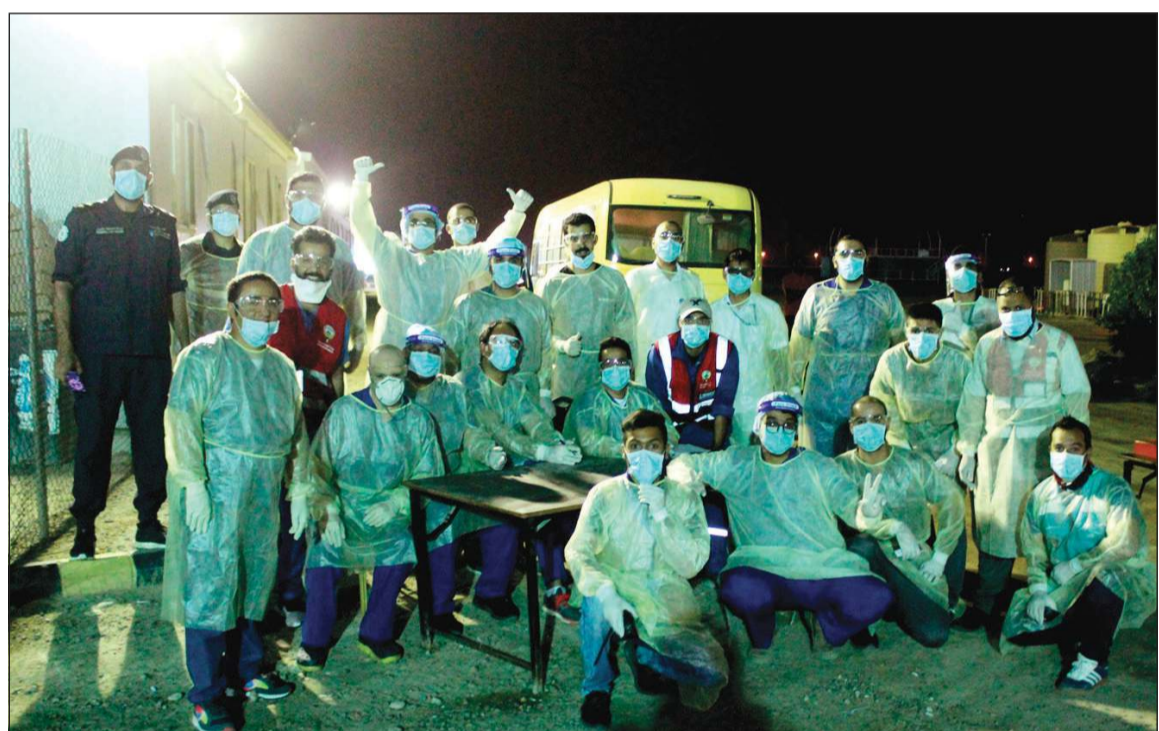
الفريق الطبي الذي يعمل في المحجر

وصولهم إلى المكان كانوا يرفضون النزول ويفضلون العودة والحجر بأماكن أخرى مثل الفنادق الخمس نجوم أو الحجر المنزلي.