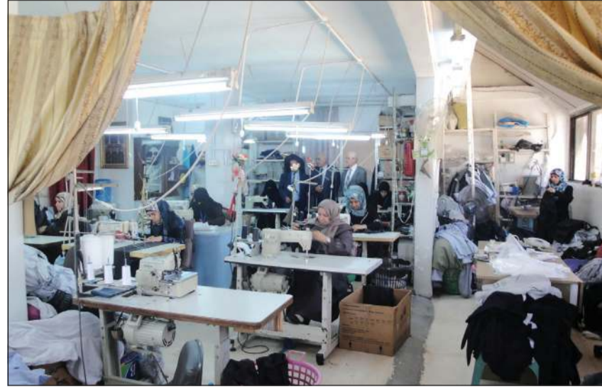
مشروع حياكة وتطريز بالاردن

الصميط: الهيئة تنتهج أفضل الممارسات العالمية في عملية قياس الأثر ومدى التغيير في حياة المستفيدين