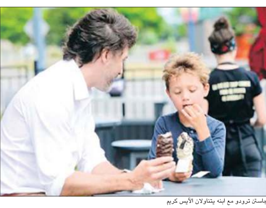
جاستن ترودو مع ابنه يتناولان الآيس كريم

أوتاوا - أ.ف.ب: ذهب رئيس الوزراء الكندي جاستن ترودو برفقة ابنه لتناول الآيس كريم أول من أمس في أول نزهة عائلية له منذ أن بدأت كندا تخفيف إجراءات العزل في مقاطعة كيبك. واستقبل رئيس الوزراء وابنه هادريان البالغ من العمر ست سنوات بهتافات في متجر شوكولا فافوري في غاتينو في كيبك. ووفقا لوسائل الإعلام، قال ترودو إن المتجر لجأ إلى إعانة فيدرالية وقرض تجاري للتمكن من اجتياز مرحلة الإغلاق التي فرضت كمكافحة وباء «كوفيد - 19». وحصل هادريان على آيس كريم بطعم القانيل مع حبة من البسكويت بينما اشترى والده آيس كريم بطعم القانيل والشوكولا. تم توجيه الأب وابنه إلى الفناء حيث نزعوا الكمامات ليتناولوا الآيس كريم.