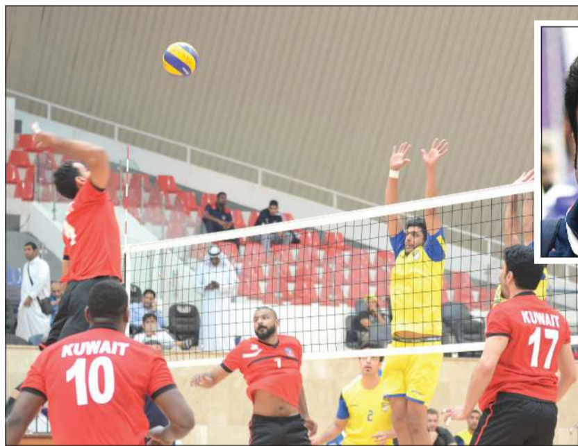
جانب من مباراة الكويت والساحل ضمن الدوري العام للطائرة