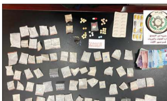
المضبوطات من المواد المخدرة وحصيلة البيع

وكيس هيروين ومبلغ 427 ديناراً بالإضافة إلى أدوات التمتع، وعليه تمت إحالة المتهم إلى جهة الاختصاص.