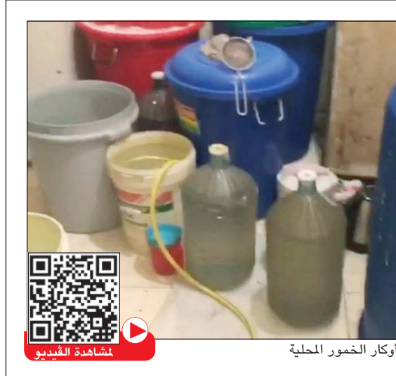
من أحد أوكار الخمر المحلية

فتحت أجهزة وزارة الداخلية تحقيقات في اتهام وافدة تعمل خادمة بأن ابن كفيها أعتدى عليها، فيما قال مصدر أمني إن التحقيقات كشفت عن وجود علاقة غير سوية بين الوافدة والشاب وهو في مقتبل العمر. واستنادا إلى مصدر أمني فإن خادمة تقدمت إلى احد محافز الاحمدية وقالت انها فوجئت بالتخطيط لإنهاء عملها وتسفيرها