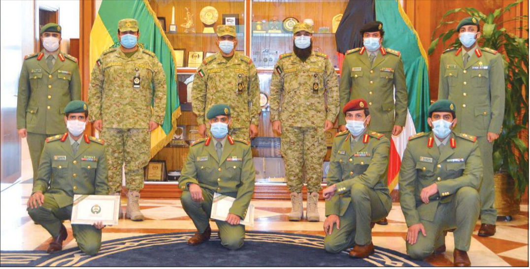
اللواء الركن فالح شجاع فالح مع المكرمين

معبدا عن شكره وتقديره للمكرمين على جهودهم في تحصيل العلم وحرصهم على الارتقاء بقدراتهم، مطالبا في الوقت ذاته بنقل خبراتهم وتطبيق ما اكتسبوه من علم ومعرفة في وحداتهم لتحقيق أهداف التطوير التي يسعى الحرس الوطني لبلوغها.