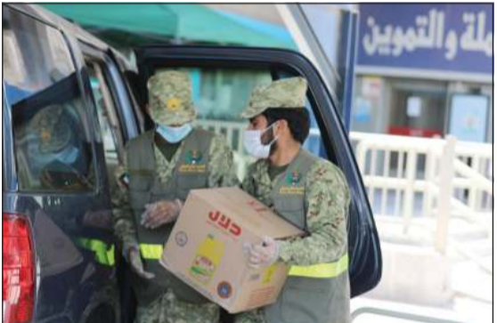
منتسبو الحرس أدوا مهامهم بسهولة ويسر