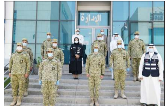
فريق الحرس الوطني المشارك في تشغيل فرع التموين في جمعية الخالدية التعاونية

من نقل وتنظيم وتوزيع المواد التموينية وأنجزوا 2614 طلباً في خدمة المواطنين، وذلك في إطار بروتوكول التعاون بين الحرس الوطني ووزارة التجارة، وبهدف مساعدتها في مواجهة الضغوط التي فرضتها أزمة فيروس كورونا.