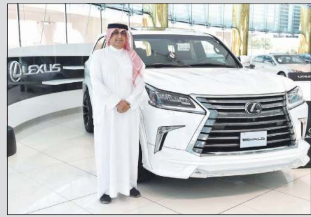
معارض للكرس السابير، مستمرة في استقبال زوارها ضمن بيئة صحية وآمنة