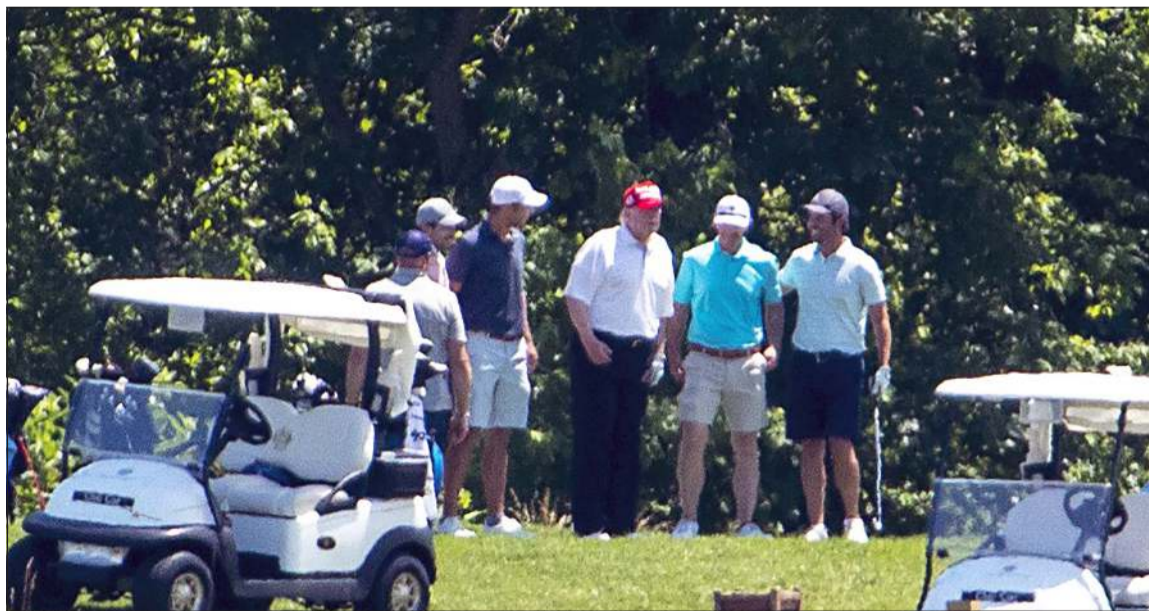
الرئيس الأميركي دونالد ترامب يلعب في نادي ترامب الوطني للغولف

قد أفسدت أمس الأول بان مستخدم تطبيق تيك توك عملوا على التسجيل من أجل الحصول على تذاكر مجانية وبعد ذلك لم يحضروا التجمع الانتخابي.