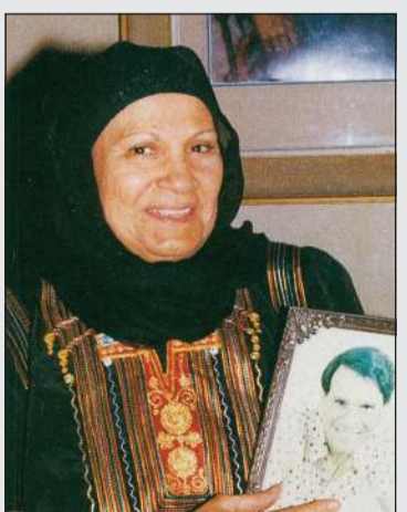
عليه شابة شقيقة العندليب

تصوير مشاهد الفيلم، وتوفي في نفس الشهر الذي توفي فيه «العندليب الأسمر». «العندليب» و«النمر» جمعتهما حب الرئيس الراحل جمال عبدالناصر، فهما أبناء الثورة، والذين سجلنا اسميهما بحروف من ذهب في ذاكرة الفن المصري العربي، ويتشابهان في أمور كثيرة، فهما من محافظة الشرقية، وفي الجانب العاطفي نجد عبدالحليم فقد حبه الاول كما يحكي المقربون منه عبر وسائل الاعلام بأنها ماتت ورحلت عن الدنيا، كما ان احمد زكي فقد الراحلة هالة فؤاد والتي ربطته بها قصة حب تكملت بالزواج وأنجاب ابنتها هيثم، وتوفاهما الله عز وجل في شبابه. انتهت رحلة «العندليب» و«النمر الأسود» الصعبة، الشيقة، المتعبة والجميلة في الوقت ذاته، وهما مثال رائع للتفاني وحب الفن من صميم القلب، وهذا ما ظهر لنا عبر الشاشة الفضية طوال تلك السنوات من الصدق والعمق وأصالة التعبير والأخلاق الراقية، رحمهما الله. وجل الاماني ان يسمو البعض من جيل اليوم بتلك الأسماء المهمة وأبلاقيات الفن، وأن يكون هناك قدر من الاحترام لزميل المهنة، ولتتقيد الروح والوجدان والعقل والأخذ بالمشورة بكل راحة صدر، وهذا ليس اقلا من احد، ولكن لعلمهم يعترفون من هؤلاء، وهذا الكلام ليس للجميع لكن للبعض، مع احترامي للجميع بالتناهية.