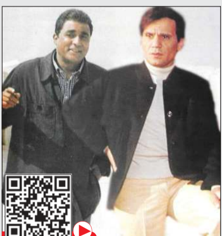
احمد زكي وعبدالحليم حافظ