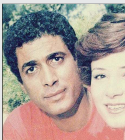
احمد زكي وهالة فؤاد

وبالأخص اخته العظيمة الست علي شابة والتي كانت بمنزلة الأم له، وحتى ثروته فقد تركها بالتساوي بين اخته واخوانه وابنة اخته التي كانت تقطن معهم، وكانت تلك المواقف هي المعاني الحقيقية للوفاء. ويأتي «النمر الأسود» أحمد زكي ليكون هو الآخر مثالا من العظماء والقامات الفنية التي سيطر التاريخ يذكر حكاياتهم ومعاناتهم وفنهم العظيم، فعندما يذكر احمد زكي يكون الجميع مرعوبا من ادائه التمثيلي غير الاعتيادي، فهو بالفعل لا يمثل بل ينقل واقعا يعيشه عبر الشاشة في كل مرة يعالج فيها امرا ما او قضية،