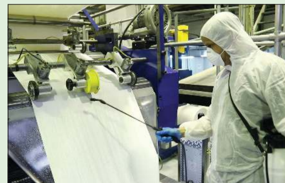
عملية التعقيم أثناء الطباعة

بعد غياب فرضه الالتزام بقرارات مجلس الوزراء بعدم توزيع الصحف الورقية والمطبوعات خلال الأسابيع الماضية، تعود «الأنباء» اعتباراً من اليوم الثلاثاء بنسختها الورقية بعد صدور قرار حكومي بالسماح بعودة توزيع الصحف خلال اجتماع مجلس الوزراء أمس. كما يأتي قرار العودة استجابة لطلب الكثير من القراء الذين ألجؤوا على العودة، ونعتر ففاءهم ومحبتهم لـ «الأنباء» رصيدنا الأكبر، ونعدهم بتقديم ما يفيدهم ويترقبونه من أخبار وتقارير