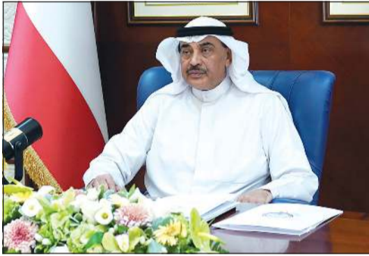
سمو الشيخ صباح الخالد مترنسا اجتماع مجلس الوزراء

قالت مصادر مطلعة في تصريحات خاصة لـ «الأنباء» إن الدولة لن تعرض أي أصول أو أسهم صندوق الاحتياطي العام أو صندوق الأجيال إلى البيع، لافتة إلى أن الحكومة لن تسحب ودائعها من البنوك المحلية. وبيّنت المصادر أنه سيتم الاستفادة من السيولة المتوافرة من الأرباح المحتجزة لدى الجهات في تأمين الرواتب كحل جزئي. وشددت على أنه لن يتم قبول أي من المقترحات التي تمس المواطن مثل تخفيض نسبة 5٪ من مشاركة الحكومة في التامينات الاجتماعية وتحميلها على الموظف. وبشأن مقترح إلغاء دعم السلع الأساسية مثل البنزين والكيروسين والديزل،