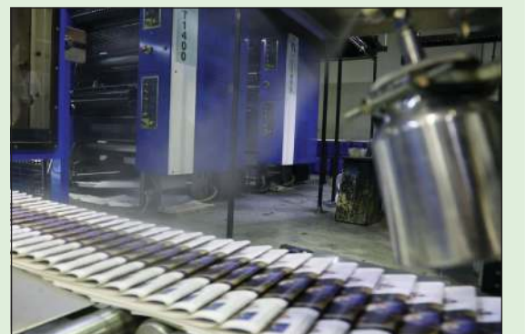
تقديم نسخ «الأنباء» فور الطباعة