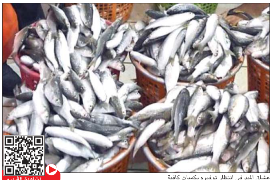
عشاق الميّد في انتظار توفيره بكميات كافية

عن أسماك الميّد عندما حدث نفوق بشكل كبير في أسماك الميّد أثبت فيها أن الغشاء الأسود في الميّد طبيعي ولا يعني أن السمكة ملوثة لكنه تصح حين ذاك بقص الذيل والرأس وعدم أكل مصارين السمكة.