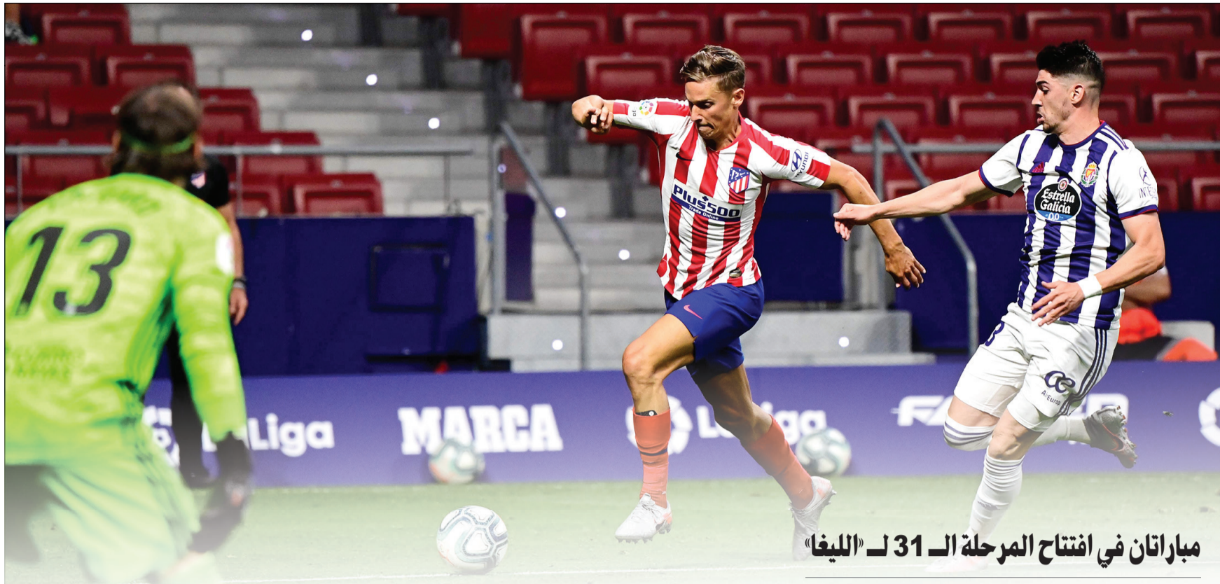
مباراتان في افتتاح المرحلة الـ 31 لـ «الليغا»