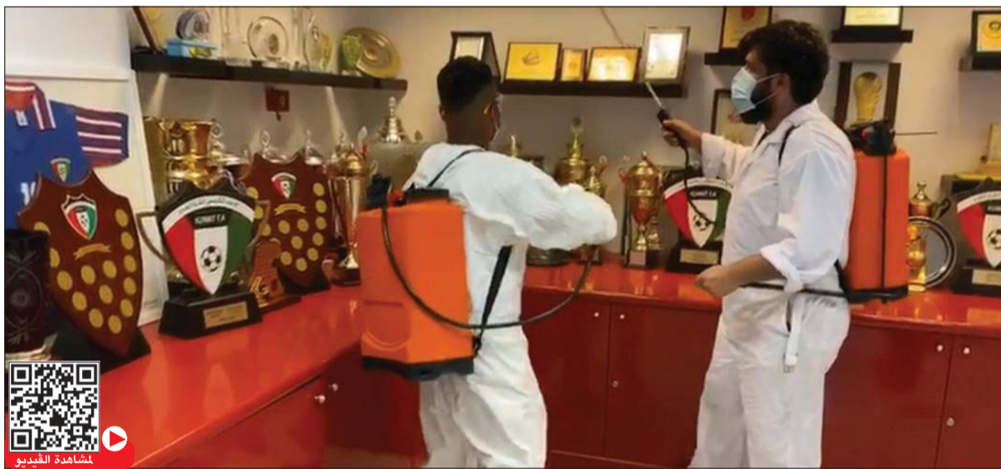
البداية بنادي الكويت واتحادات الرماية والجودو والكراتيه وألعاب القوى